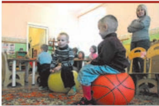
мывку сделали, даже поставили стеклопакеты, а все то же самое.

На этой неделе представи-тели «Пермской сетевой компани» (ПСК) посетили замерзающий район, в частности Централь-но-тепловой пункт № 25, обслужи-вающей дома по улицам Мака-ренко, Добролюбова, Тургенева и детский сад № 134.