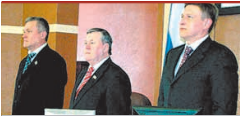
Все четыре года они стояли... по стойке «смирно!»

Пять лет законодатели исполняли прихоти губернатора, нарушающие права населения.