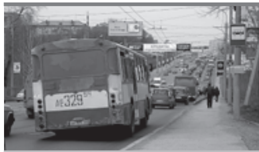
Когда в Перми переведутся «хромые» автобусы?!

Сейчас автобусные маршруты распределяются без конкурса. В департаменте дорог и транспорта (ДДиТ) приходят новые чиновники, у которых другие взгляды на жизнь, и все снова перестраивается с ног на голову. Легализуются нелегальные маршруты, которые ломают сложив-