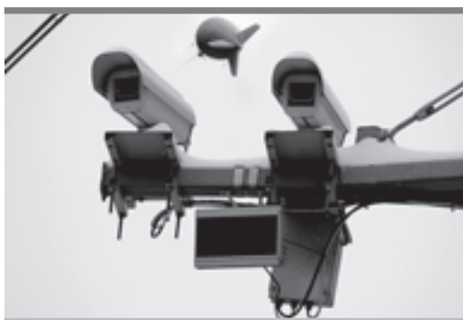
«Глаза» города не видят преступлений