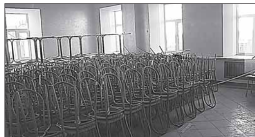
Столовая ждет посетителей

Неужели Пермь против подписанного президентом документа о развитии спецшкол и гимназий?