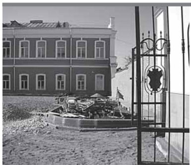
Благоустройство двора продолжается

Аукцион по отбору подрядчика для проведения капитального ремонта гимназии был объявлен еще в декабре 2010 года, но побе-