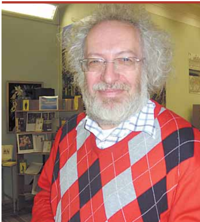
Алексей Венедиктов: «Лично для меня человек с убеждениями — это основа для разговора»

— Путина я знаю лет 15. Он хороший лицедей, у него маска — как у Бэтмена. Иными словами, как и всякий политик, он умеет создавать образ. Хорошо играет свою роль в публичном мире. Так, в общем, и должно быть. На пресс-конференциях он сам себе предоставляет слово. И журналист, который готовится к пресс-конференции с ним, должен это понимать. Впрочем, в любом интервью вы должны понимать, к кому вы идете, кто будет сидеть перед вами. И всё зависит от первого вопроса. А второй вопрос — следствие первого. Это закон журналистики. Второй закон: журналисты должны уметь воровать информацию.