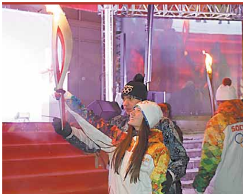
Исключительность момента чувствовал каждый участник

4 января Пермь приняла Эстафету Олимпийского огня.