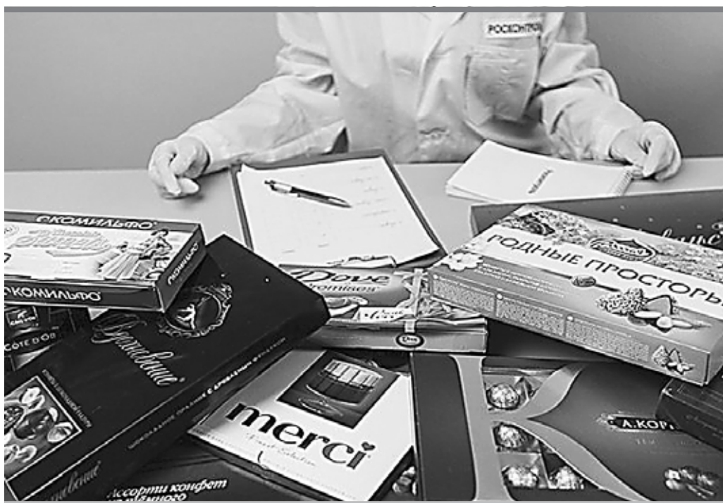
Самыми «шоколадными» оказались конфеты Merci и «Коркунов» (массовая доля шоколада в них 53,6 и 50% соответственно)

Чемпион по калорийности и жирности – Ferrero Rocher: в 100 г содержится