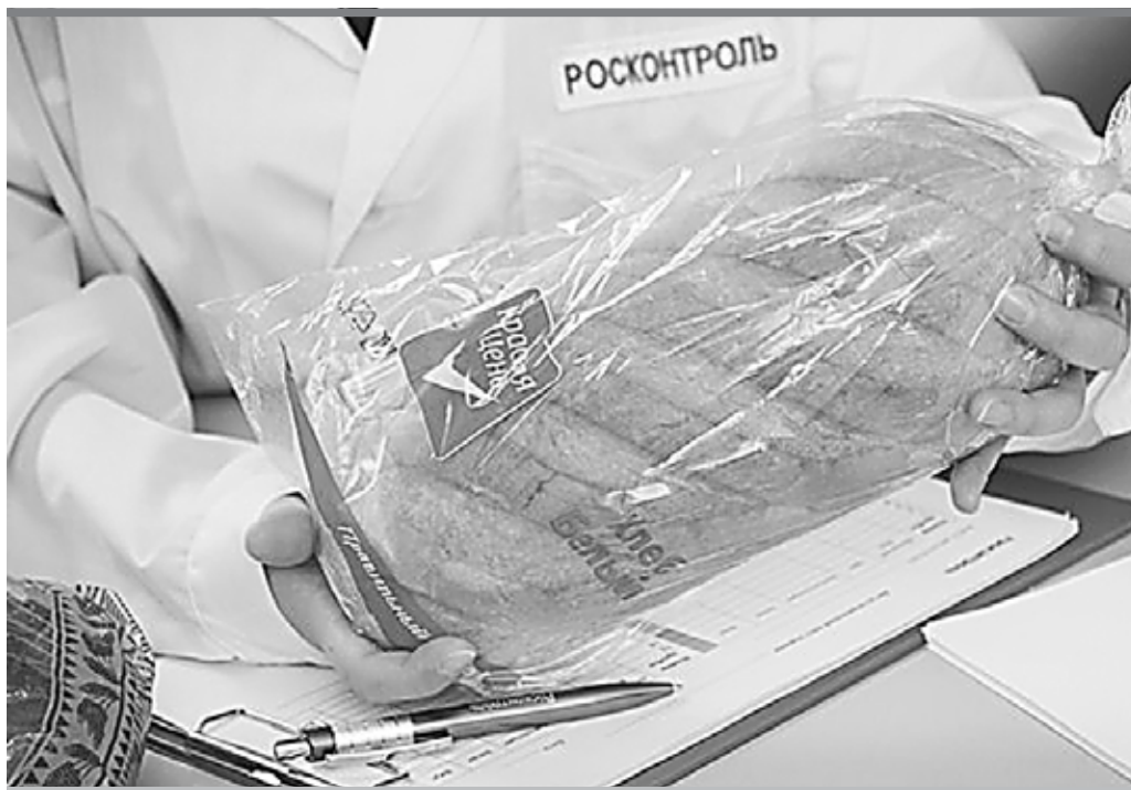
Красная цена сегодняшнему хлебу, в котором занижено количество белка и превышена норма содержания соли, должна быть в разы меньше рыночной

«Росконтроль» решил проверить рецептуру современного хлеба и удостовериться в его качестве. Эксперты исследовали 6 марок дарникового и украинского хлеба («Коломенский», «Настюша», «Зерница», «Пролетарец», «Каждый день» и «Чудесный край») и столько же марок батона нарезного и белого хлеба из пшеничной муки высшего сорта («Хлеб 28 завод», «Коломенское», «Волконский», «Шелковохлеб», «Красная цена», «Harry's American Sandwich»). Образцы были закуплены на столичном хлебозаводе, в супермаркетах и в пекарне.