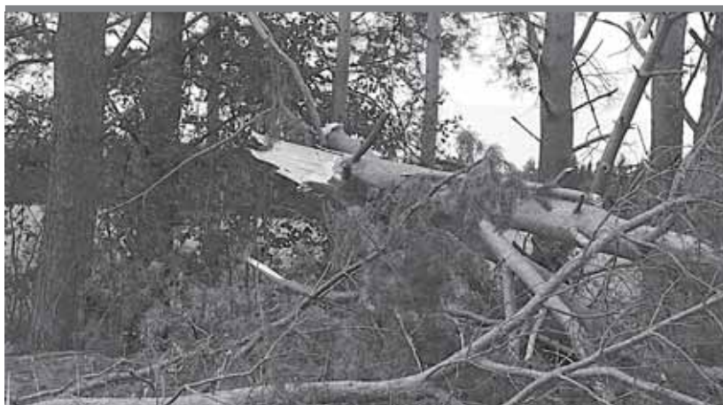
Из-за поваленных деревьев был невозможен проезд из Гаревой в Фоки

ситуации. Решение об этом принято администрациями Фокинского, Ваньковского и Больше-Букорского сельских поселений. Необходимость введения чрезвычайного положения вызвана необходимостью срочной ликвидации последствий урагана.