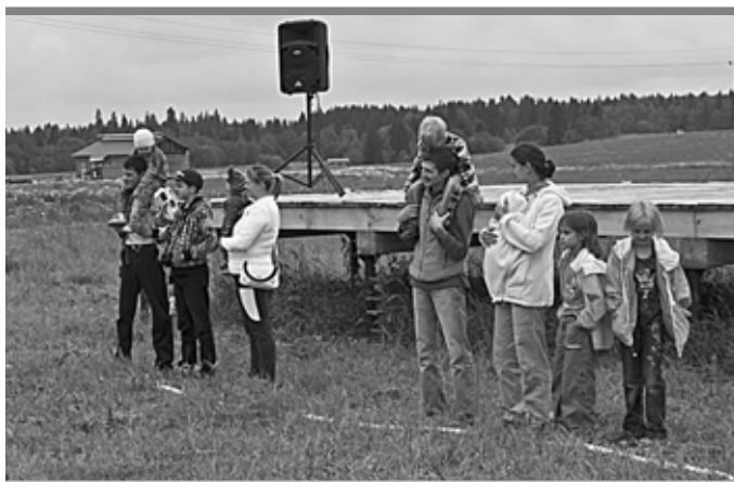
Ана Липовой семьи уже строят дома и проводят совместные праздники

Однако на основании ходатайства ТУ Росимущества в Пермском крае определением Семнадцатого арбитражного апелляционного суда (дело № А50-18599/2013) в