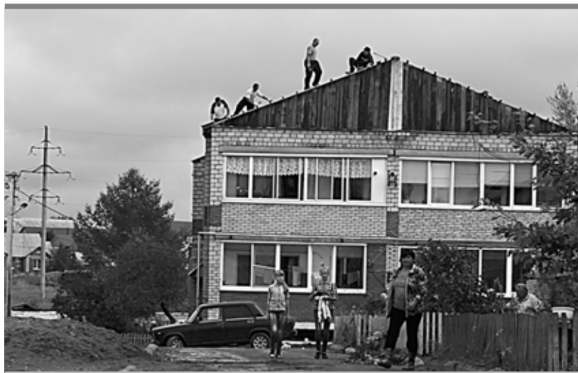
С 80 домов и социально значимых объектов были сорваны крыши

В Чайковском районе ликвидируют последствия урагана. В трех населенных пунктах объявлен режим ЧС.