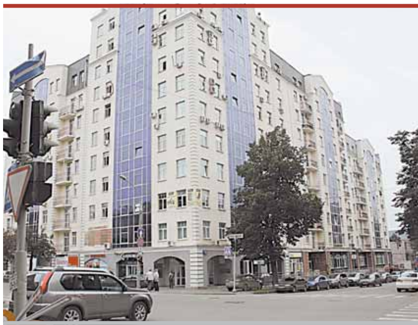
Современное красивое здание бизнес-центра практически не охраняется