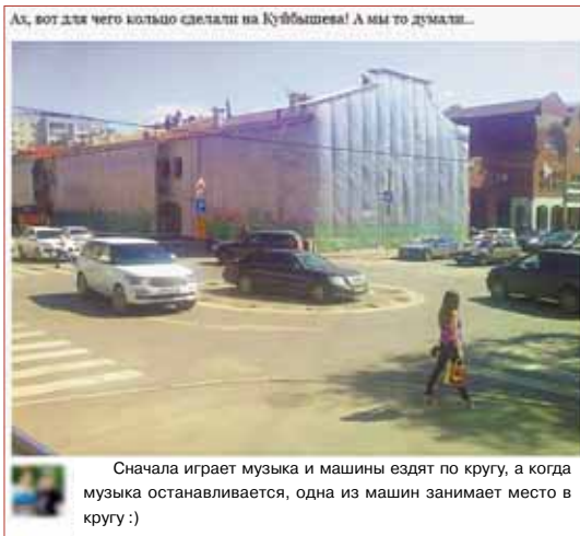
Сначала играет музыка и машины ездят по кругу, а когда музыка останавливается, одна из машин занимает место в кругу :)

Если бы мы проектировали этот перекресток с нуля, то сделали бы пешеходные переходы дальше от кольца. Но мы вписываемся в существующую реальность, поэто-