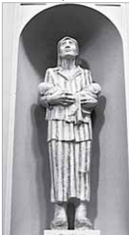
Памятник Станиславе Лещинске в Церкви св. Анны около Варшавы

В концентрационном лагере все дети — вопреки ожиданиям — рождались живыми, красивыми, пухленькими. Природа, противостоящая ненависти, сражалась за свои права упорно, находя неведомые жизненные резервы. Природа является учителем акушера. Он вместе с природой борется за жизнь и вместе с ней провозглашает прекраснейшую вещь на свете — улыбку ребенка».