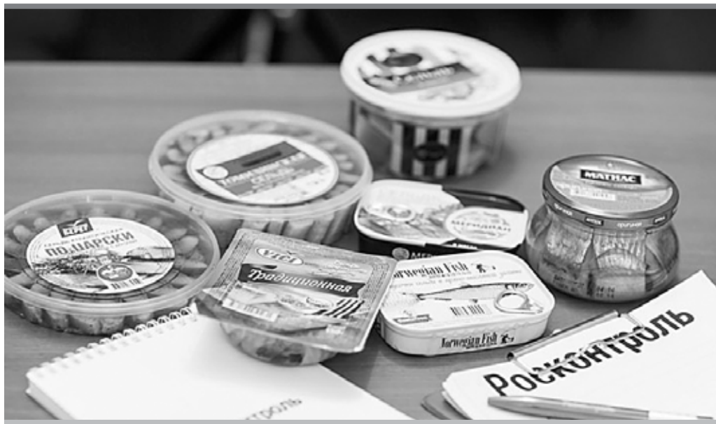
Селетка богата биологически ценным и легкоусвояемым белком, витаминами А, D, E, B12, кальцием, фосфором, йодом, магнием, натрием, цинком, фтором

Эксперты пытались выяснить, какая соленая сельдь лучше. Испытывались: