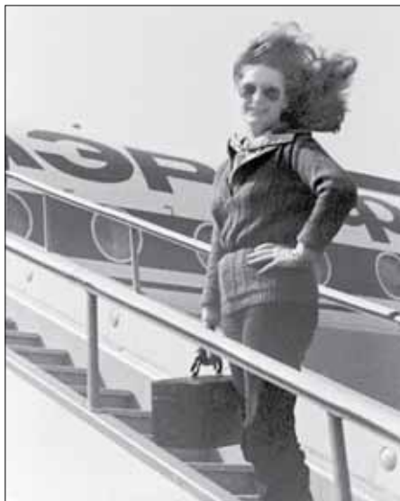
Алла Пугачева на гастролях, 1970-е

Здорово, что, помимо известных журнальных фотографий, можно найти действительно редкие кадры. Такие снимки хочется рассматривать бесконечно, особенно если это снимки известных личностей. И вдвойне интереснее, если это наши соотечественники. В AdMe.ru прошерстили архивы и собрали фото известных россиян, сделанные в непривычной для нас обстановке. Они открывают совсем другую сторону этих людей. За каждым таким снимком скрывается целая жизнь, а иногда и целая история.