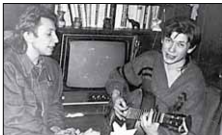
«Би-2» в начале своей карьеры