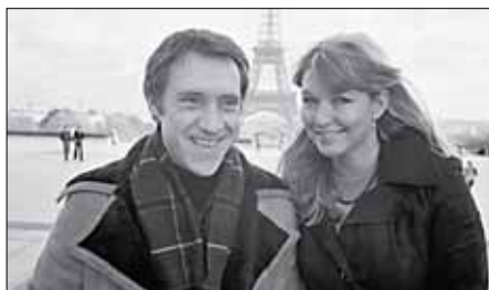
Владимир Высоцкий и Марина Влади в Париже, 1977 год