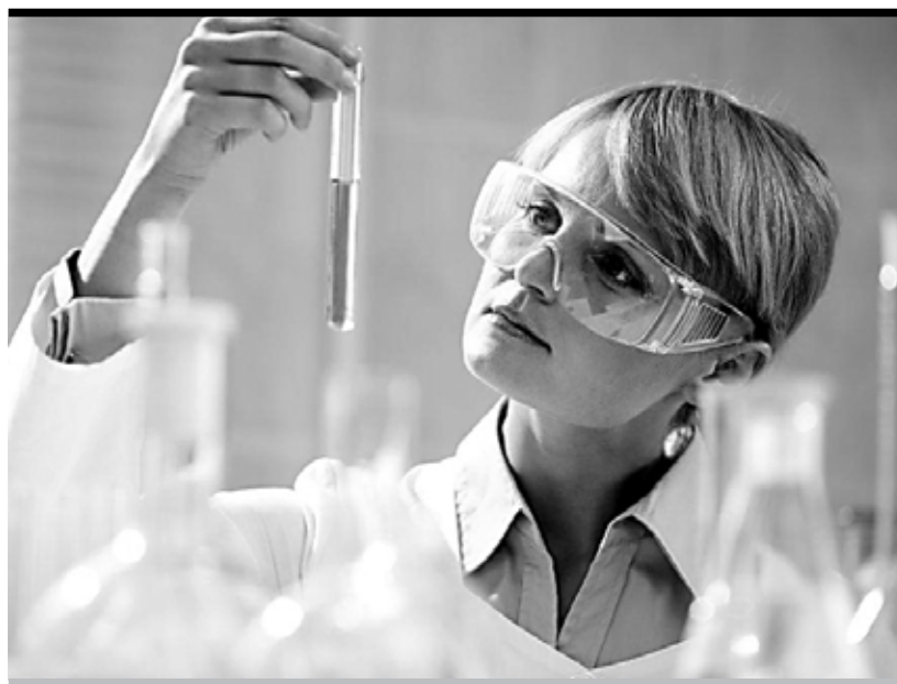
Многочисленные нарушения качества бутилированной воды легли в основу целого ряда расследований, проводимых специалистами «Росконтроля» с целью защиты прав потребителей

А пока, в связи с отсутствием конструктивного диалога со стороны бизнеса, ОЗПП «Росконтроль» направило иски в суд с целью восстановления прав самого незащищенного звена — потребителя.