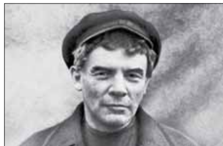
Владимир Ленин перед Октябрьским восстанием

Ежедневная газета «Пермский обозреватель». Выходит 5 раз в неделю. РАСПРОСТРАНЯЕТСЯ БЕСПЛАТНО