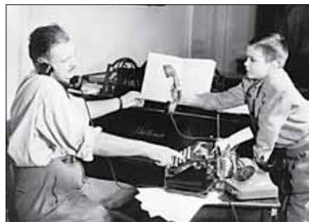
Писатель Сергей Михалков и его сын Никита, 1952 год