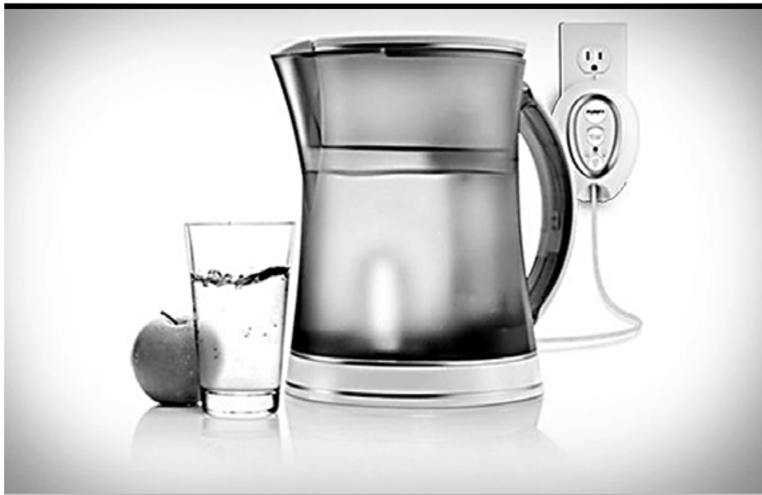
В погоне за коммерческими интересами без должного внимания оказывается качество самой питьевой воды

Не вдаваясь в эмоциональную составляющую, хочется отметить, что даже при углубленном изучении деятельности СПБВ не получилось найти информацию о заботе о потребителях. Отсут-