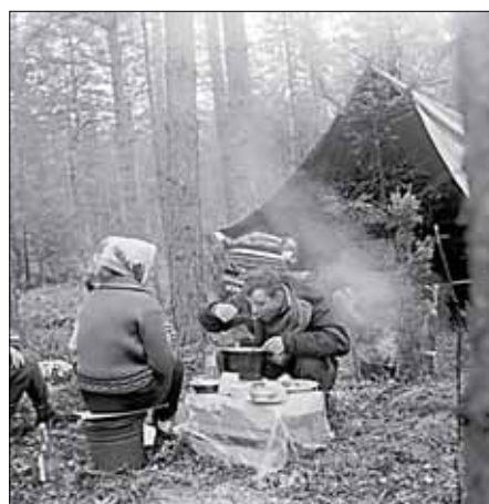
Юрий Гагарин во время пикника в лесу