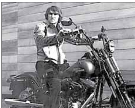
Хоккеист Александр Овечкин за рулем Harley-Davidson