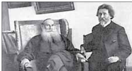
Лев Толстой и Илья Репин в Ясной Поляне, 1907 год