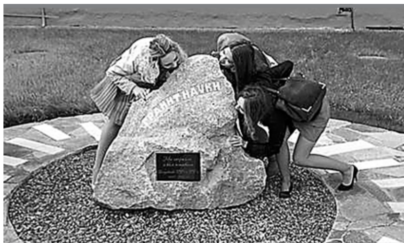
Будет ли по вкусу университетский гранит науки школьникам?