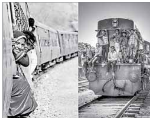
Поезда в Индии