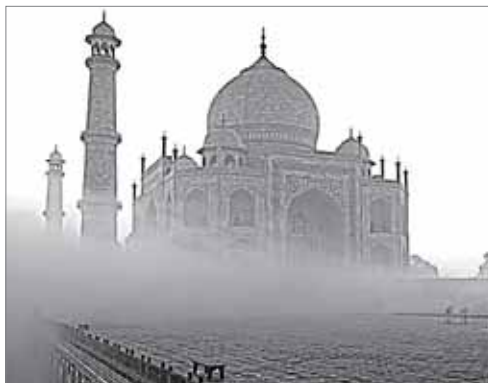
Тадж-Махал, город Агра

Индия многогранна, непредсказуема и порой безумна. Но даже сумасшествие здесь какое-то спокойное. Вы научитесь никуда не торопиться, потому что ваш поезд опоздает в лучшем случае на сутки. Не будете злиться, если не найдете свои вещи там, где их оставили. Просто так Индия проверяет вас на прочность и учит умению обходиться самым малым. И, даже если вы пройдете все эти испытания и заречетесь, что никогда больше ваша нога не ступит на эту древнюю землю, AdMe.ru обещает — вернуться сюда вам обязательно захочется!