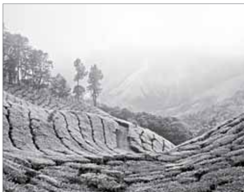
Крупнейшая чайная плантация Индии Муннар