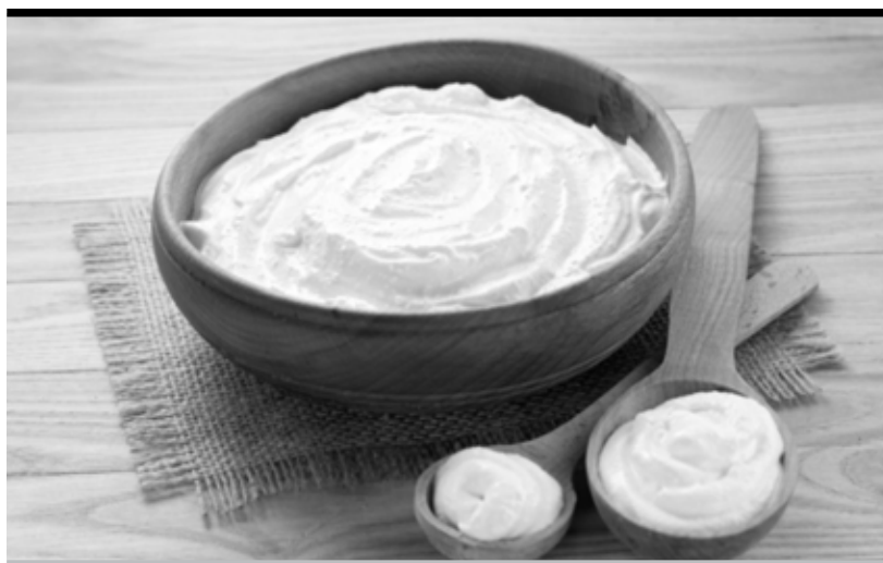
Сметану по праву можно считать сестрой хлеба на столе — она сытная и полезная

При заквашивании структура молочного белка меняется, и он становится легко усвояемым. Кроме этого в сметане содержится лецитин, растворяющий холестерин и не позволяющий ему откладываться на стенках сосудов. В 100 граммах этого молочного продукта — четверть суточной нормы холина, вещества, ответственного за работу мозга, память и интеллектуальные способности. Также холин очень важен в период беременности, поскольку благоприятно влияет на развитие мозга ребенка в утробе матери.