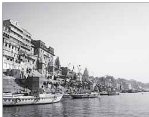
Город Варанаси

Ежедневная газета «Пермский обозреватель». Выходит 5 раз в неделю. РАСПРОСТРАНЯЕТСЯ БЕСПЛАТНО