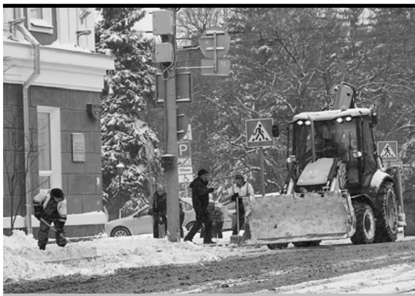
К зиме, конечно, дорожники, были готовы, а вот к снежному циклону «Ливия» — нет

ление ожидается лишь в среду, однако оно будет сопровождаться сильным снегопадом и метелью. В результате высота снежного покрова в Перми к утру 23 октября