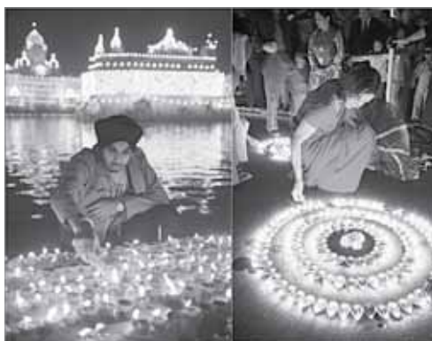
Индийский праздник света Дивали