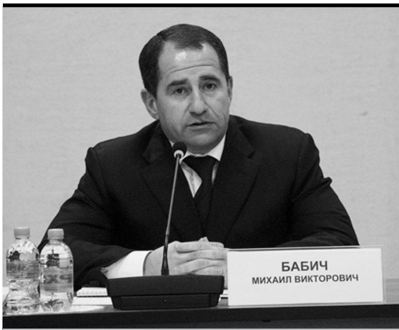
«Именно в Пермском крае есть все условия для создания кадетского училища военно-промышленного профиля»

Михаил Бабич: «Впервые в истории Советского Союза и новой России будет создано кадетское училище военно-промышленного профиля. Именно в Пермском крае созданы все условия для этого. Здесь есть и научная, и промышленная, и интеллектуальная база, которая