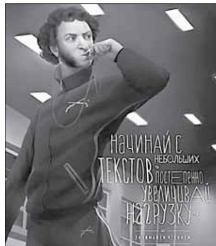
Рекламное агентство SLAVA