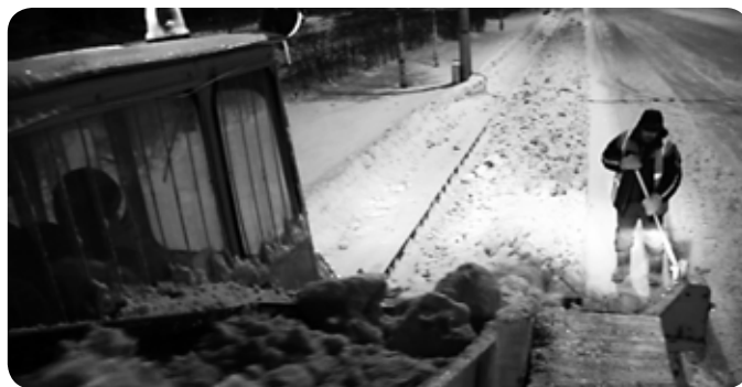
Прометание, вывоз снега, чистка выездных карманов, остановочных комплексов, пешеходных переходов