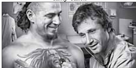
Рекламное агентство «Небо»