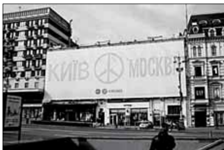
Всем мира. S7 — уважение и спасибо. Креатив — Гриша Сорокин