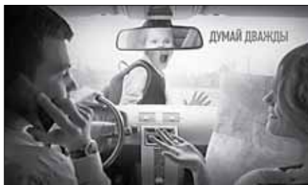
Рекламное агентство Red Pepper