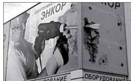
Воронеж. Дизайн и идея были придуманы в рекламном отделе компании