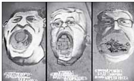
Ямы с портретами политиков от РА «Восход»