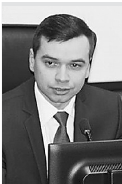
Игорь Вагин, председатель Избирательной комиссии Пермского края: «Система избирательных комиссий должна быть настроена на обеспечение конкурентных, открытых, а значит легитимных выборов»

Территориальные избирательные комиссии обучили всех членов УИК. Повысилась активность ТИК в информационной среде, усилилось взаимодействие с общественными организациями и СМИ. Во II полугодии года количество лиц, зачисленных в резерв составов УИК, предложенных общественными объединениями, выросло на 13,6% по сравнению с I полугодием. Благодаря деятельности избиркомов по созданию безбарьерной среды