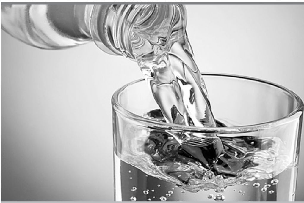
Ледниковая, талая и горная вода – безопасны и полезны, если разливаются из источников, расположенных у подножия гор

Требования к воде I категории достаточно мягкие: в основном, даны показатели «не более», то есть, например, калий <20, магний <65. Получается, необходимых минералов и микроэлементов в такой воде может и не быть.