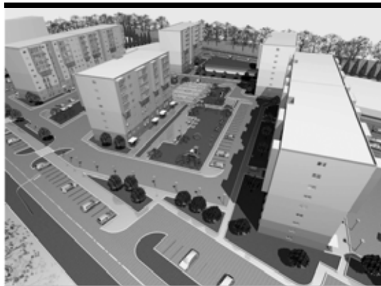
Проектом предусмотрено строительство пяти домов

— По уточненному графику первый дом, согласно договору, заключенному Корпорацией развития Пермского края, мы обещаем закончить до конца лета 2015 года. Еще два — до конца сентября того же года, затем — четвертый и пятый дом, где также будет про-