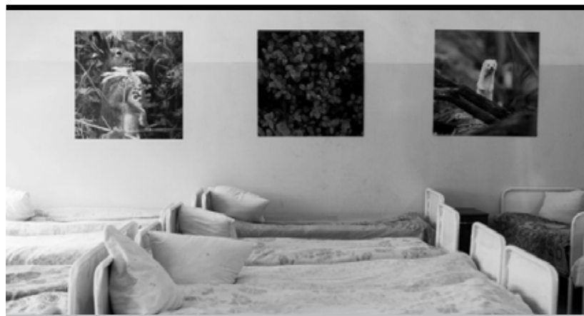
Интерьеры спальных комнат украсили фото проекта «Красота леса»

картины: греющие душу пейзажи и милые зверушки.