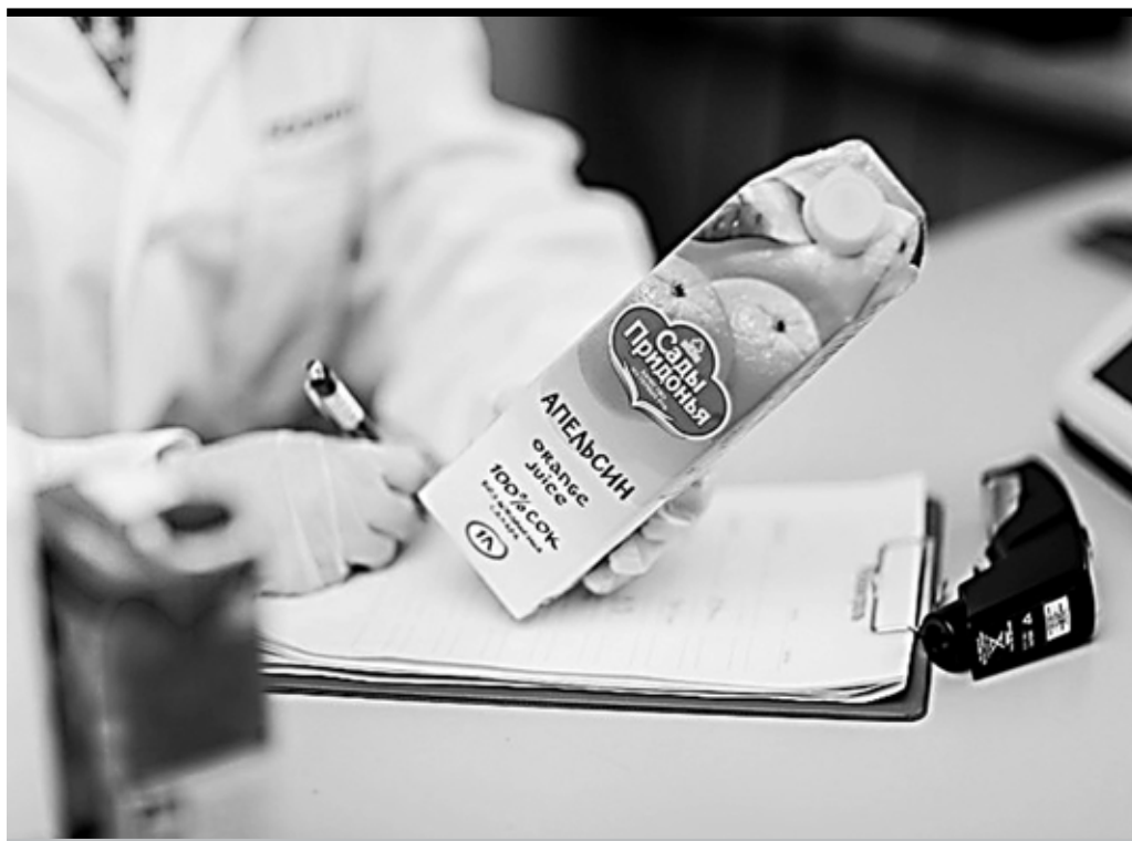
Противопоказанием к употреблению апельсинового сока является аллергия

Из фруктов выжимают сок, потом его нагревают, выпаривая воду, и уже на производстве разбавляют сок водой – восста-