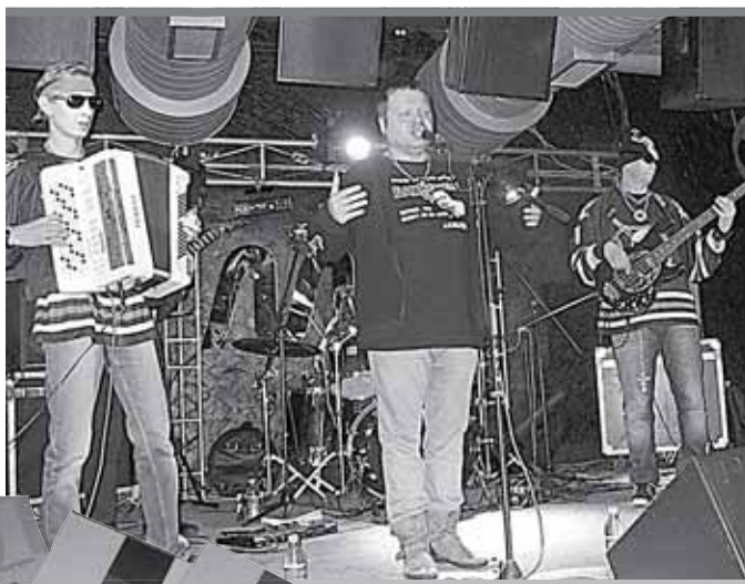
Задачи «ГУЛа» — создание реального поэтического кластера