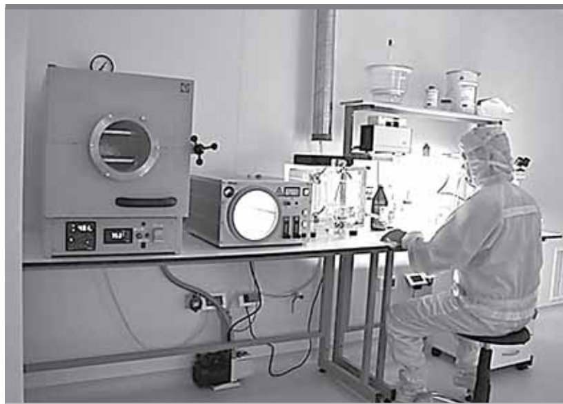
В состав исследовательской группы вошли ученые разных лабораторий Пермского университета

Научный коллектив ПГНИУ приступил к созданию детектора смертельно опасных органических загрязнителей – ПХБ.