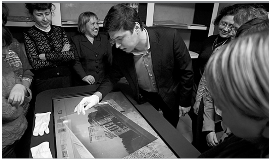
Новые технологии на службе архивистов