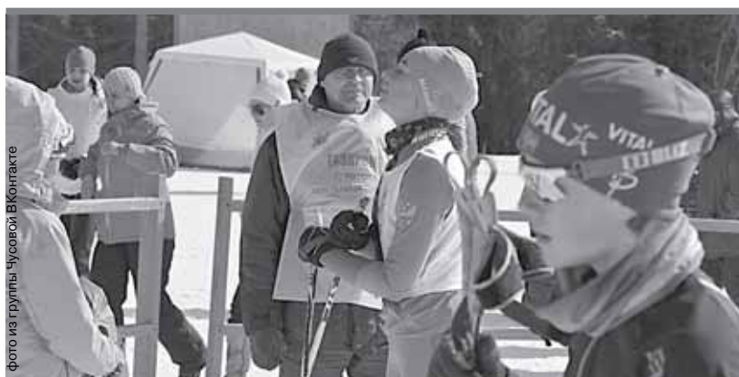
Чусовой на всю страну известен своими спортсменами — лыжниками и саночниками

В Чусовом представили способы повышения инвестиционной привлекательности территории.