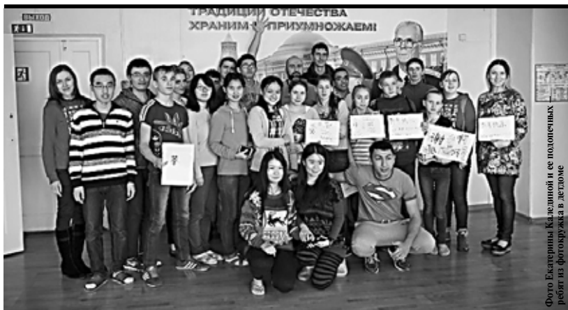
Иностранные гости и ребята из детдома нашли общий язык за каллиграфией

В гости к ребятам с ул. Светлогорской уже приезжали студенты из Египта, Румынии, Палестины и Катара. В этот раз географический размах шире: встречи с ребятами ждали студенты из Китая, Сирии, Палестины, Марокко, Узбекистана и Азербайджана. Они приехали в Пермь, чтобы получить высшее образование в Политехническом университете или в Фармацевтической академии.