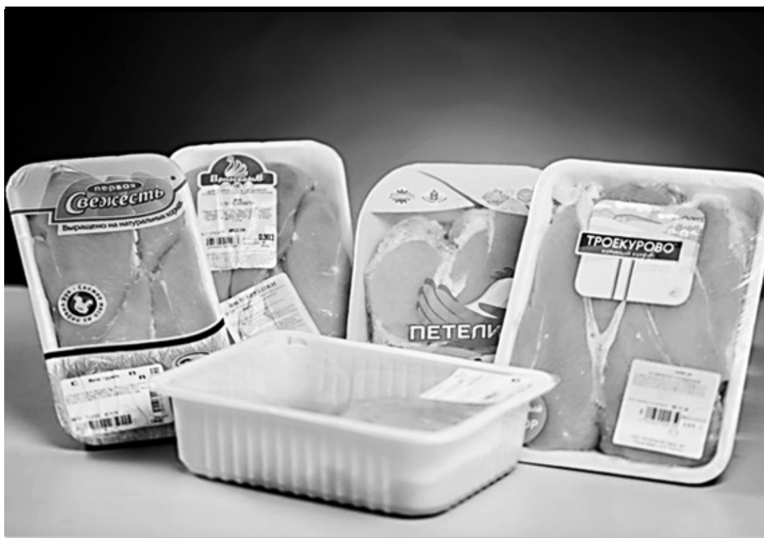
Высокая цена отнюдь не гарантирует безопасности и качества продукта

курицу варить или запекать строго до готовности. Сальмонеллы погибают при температуре 73 градуса