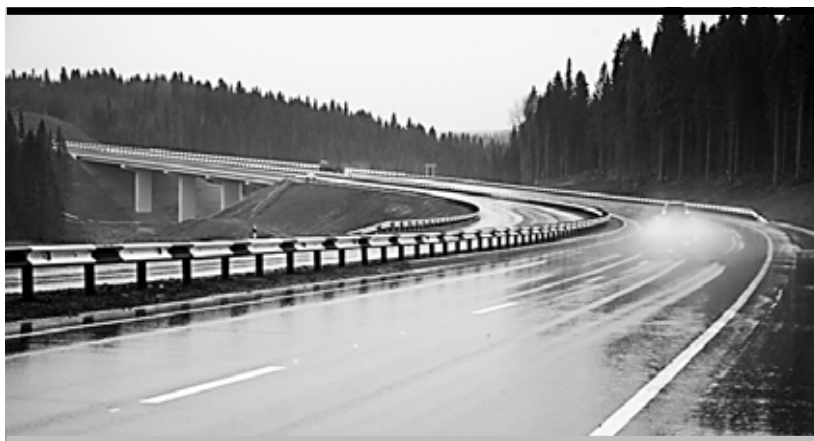
Это не локальный проект. Это развитие национального коридора Томск–Ивдель, который проходит по Пермскому краю

Об наших заявленных инфраструктурных проекта – строительство моста через Чусовую и