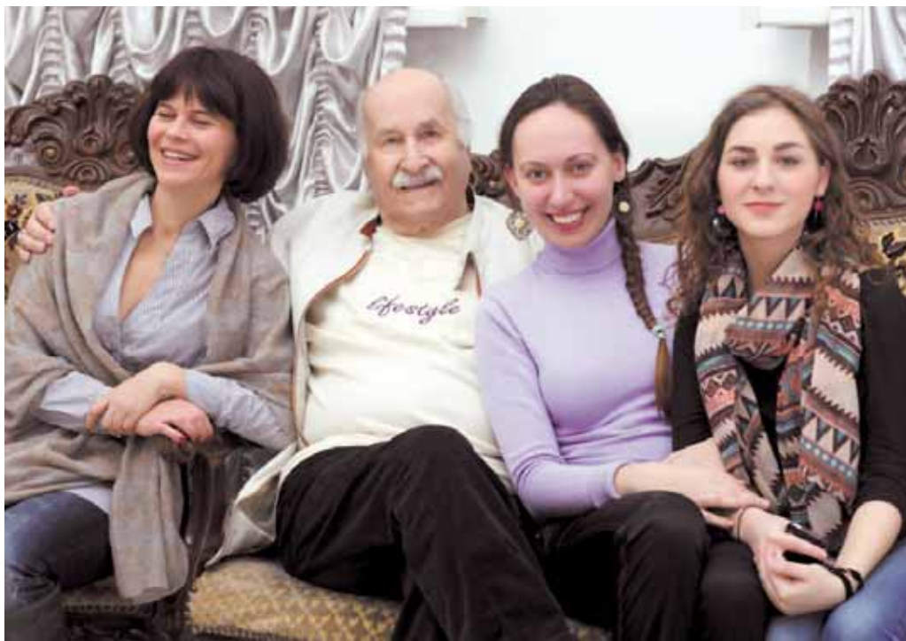
Владимир Зельдин никогда не был обделен женским вниманием...

Мое любопытство к жизни тоже способствует омоложению, отодвигает старость в сторону. Как говорил мой герой Гульермо Сперанца, «когда человек начи-