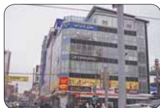
«Моби Дик» на ул. Екатерининской (узаконен)