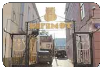
«Бегемот» на ул. Сибирской (суд идет)