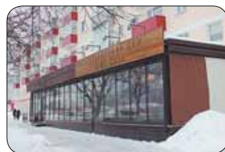
«Кофе Сити» на ул. Ленина (суд идет)