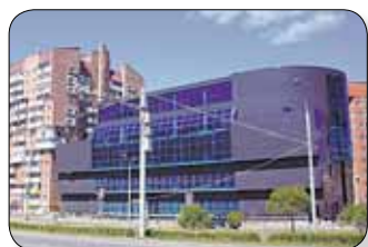
«Черный гроб» на ул. Революции (узаконен)