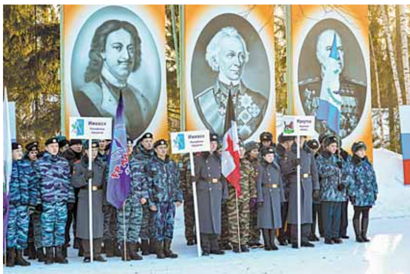
Слет занял важное место в системе патриотического воспитания молодежи

Сегодня, 21 февраля, в Пермском кадетском корпусе Приволжского федерального округа закончится 13-й международный слет «Равнение на Победу!».