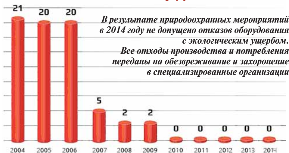
Число отказов оборудования ООО «ЛУКОЙЛ-ПЕРМЬ» с экологическим ущербом

В результате природоохранных мероприятий в 2014 году не допущено отказов оборудования с экологическим ущербом. Все отходы производства и потребления переданы на обезвреживание и захоронение в специализированные организации