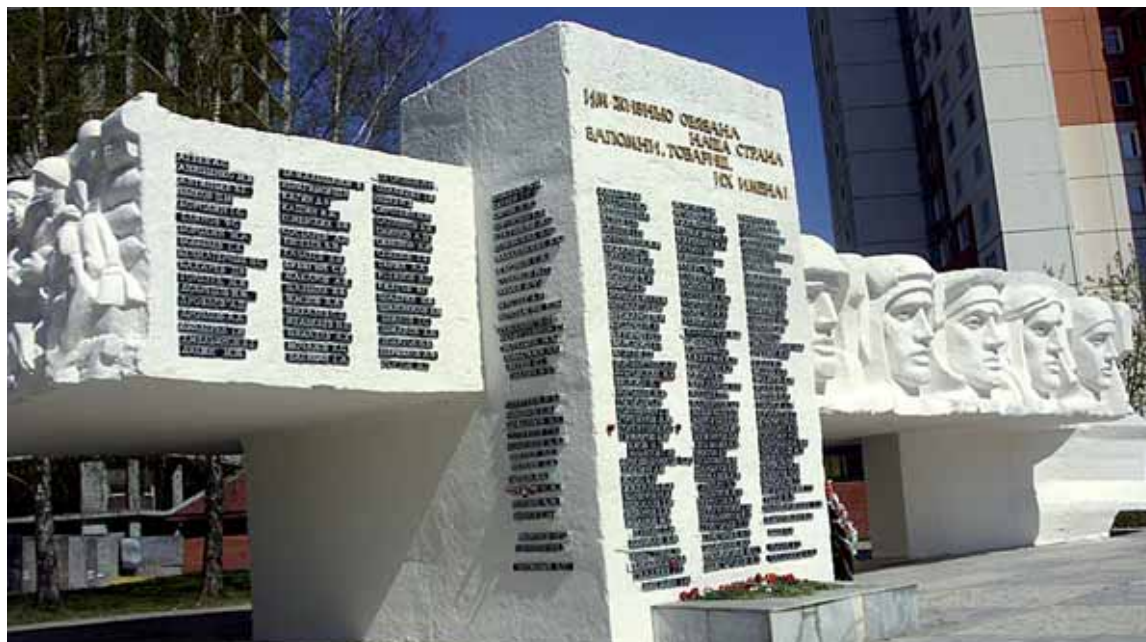
В Перми насчитывается около 600 мемориальных мест в память о Великой Отечественной войне