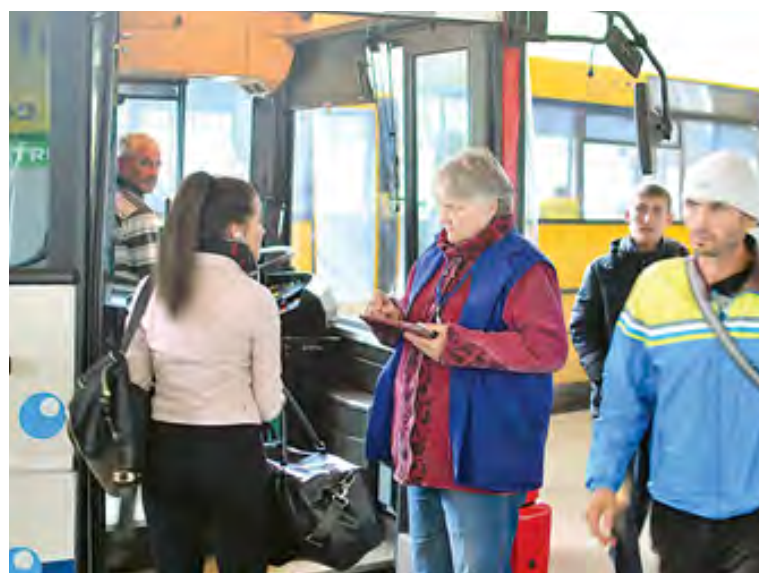
Пока чиновники играют с технологиями, страдают пассажиры