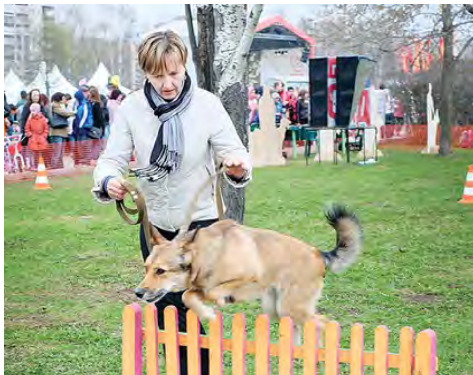
Показательные выступления Центра собаководства всегда привлекают много зрителей