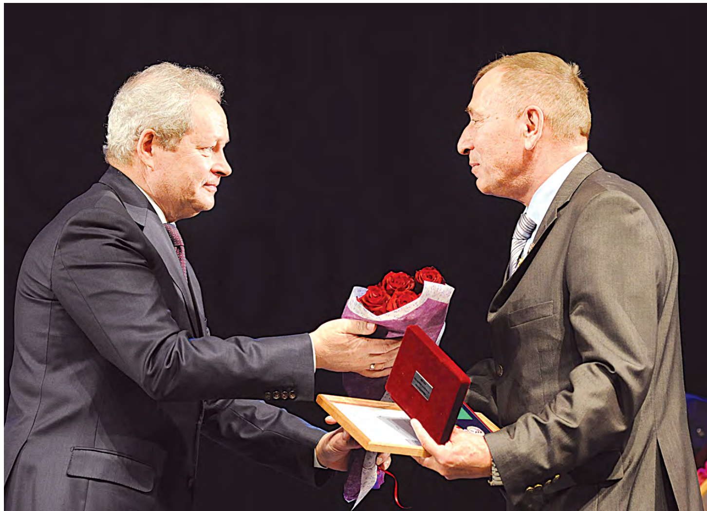
Лучшие сотрудники сельхозпредприятий получили благодарственные письма из рук главы региона

В Пермском крае реализуется 140 аграрных инвестпроектов. За последние три года в сельское хозяйство направлено свыше 9 млрд руб., в этом году общий объем вложений составит еще 3 млрд.