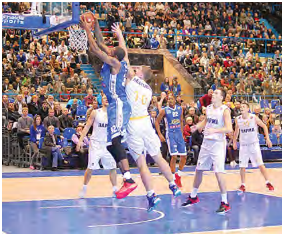
«Парма» так и не смогла сдержать атаки «Калева»