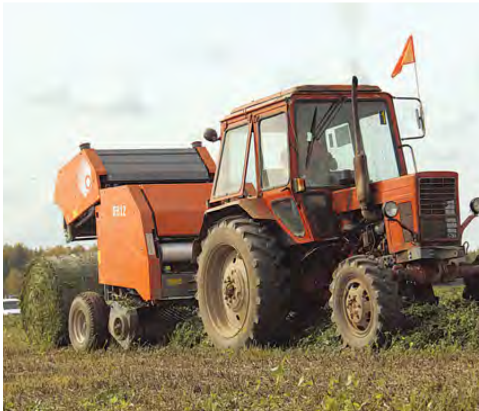
Так в Пермском крае заготавливают сенаж в упаковке — корм для животных

— Мы уже почти закончили уборку урожая. 89% площадей убрано. На остальной земле просто ничего не выросло или выгорело полностью, — говорит Татьяна БУГАЕВА, специалист аграрно-промышленного отде-