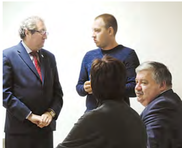
Комиссия обсуждает сложившуюся ситуацию

Хочу рассказать об одном показательном случае. В мае того года началась всероссийская кампания помощи детям, страдающим гидроцефалией. Интернет заполнили ужасающие фотографии, вызывающие неприятную эмоциональную реакцию обывателя, который не в состоянии профессиональ-