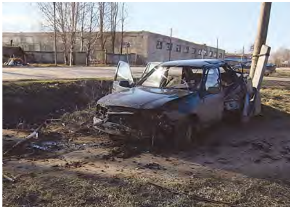
8 мая в Кудымкаре пьяный въехал в столб: 24-летняя девушка погибла, 25-летний пассажир — в реанимации

Всего с начала года в Пермском крае зарегистрировано 104 ДТП, в которых пострадали юные участники дорожного движения. 5 детей погибло (3 не были пристегнуты ремнями безопасности),