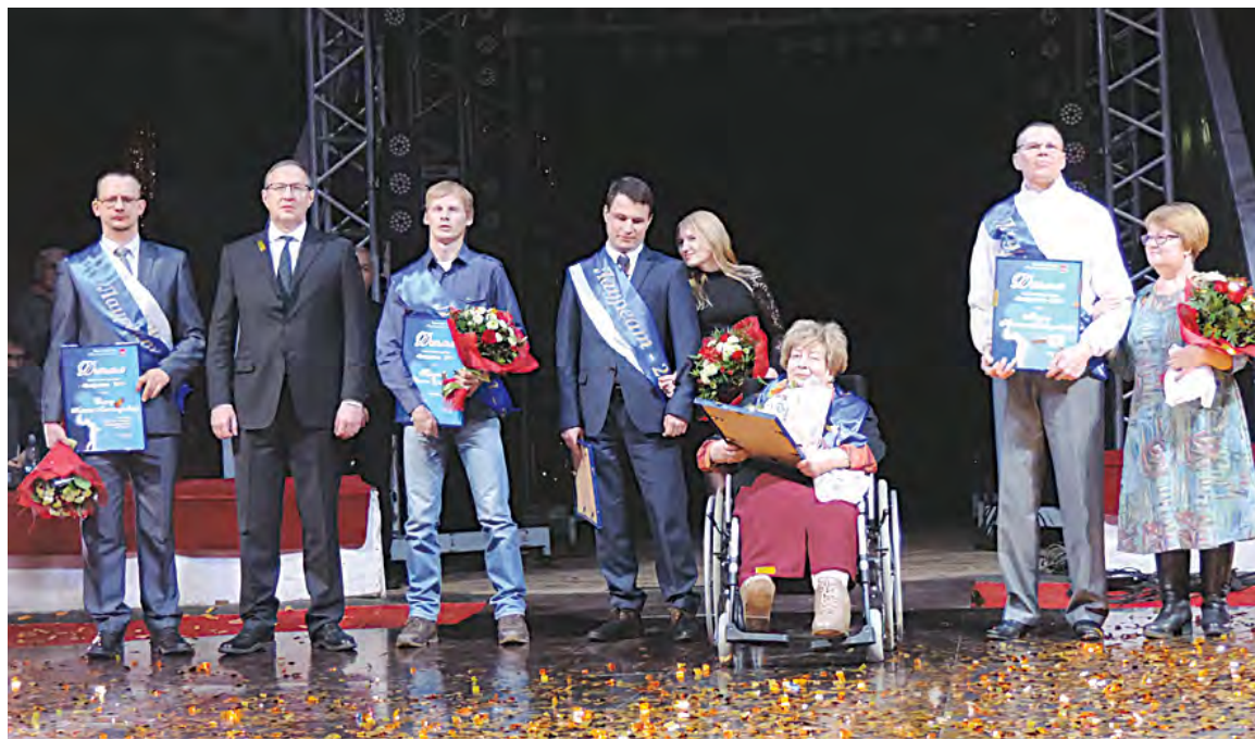
Победители премии «Преодоление»

В Перми наградили лауреатов 10-й по счету премии «Преодоление».