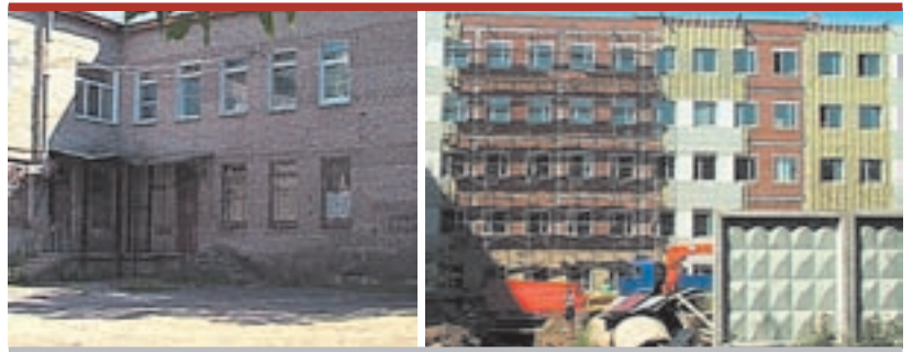
Переезда из старого корпуса в новый врачи ждут четвертый год