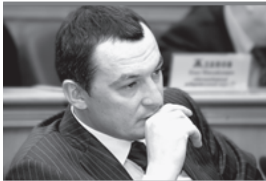
Да, нелегкая это работа — тащить «ЕдРо» из болота

Благодаря проведенному соцопросу, который показал, что у меня очень высок уровень доверия у населения, у меня есть возможность вести переговоры — и я это делаю — со всеми политическими силами как регионального, так и федерального уровня, а также с исполнительной властью. Все эти годы, будучи депутатом ЗС, я был в оппозиции, так как считал и считаю, что многие законопроекты, которые были приняты в стенах ЗС с подачи правительства края, идут вразрез с интересами моих избирателей и жителей края в целом. Я всегда честно высказывал свою позицию. Собираюсь делать это и впредь. Но при этом