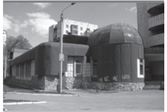
Вместо того чтобы отремонтировать школу, краевые власти ее ликвидируют

Многие пермяки приняли такое посильное участие в судьбах Пермской художественной галереи и краевой школы для детей-инвалидов — поставили свои подписи под открытыми письмами в защиту учреждений. Добились немногого: в галерее перестали жечь свечи и проводить церковные службы. А краевой школы для детей-инвалидов не будет. До 5 октября ее должны присоединить к школе для детей с нарушением слуха (м/р Южный).