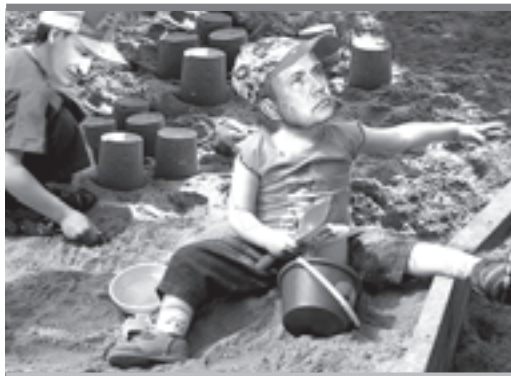
Не мешайте нам строить наш город!

В комментариях к лучезарным фотографиям кандидата на предвыборных листовках блогеры напомнили Агешеvu и его «элитарные замашки», и ИФ