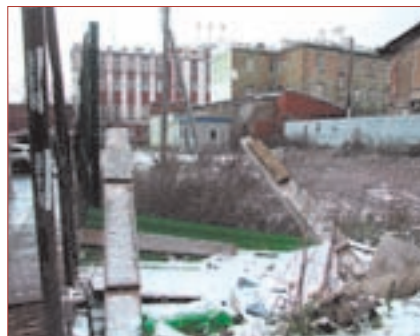
Мусор прямо напротив гордум

Ответственность за все это безобразие в любом случае несут районные власти, которые сегодня имеют право спрашивать и с управляющих компаний, и с отдельных подрядчиков. Поэтому в скором времени «НеСекретно» планирует выбрать «победителя» — назвать самый грязный район и прославить главу его администрации.