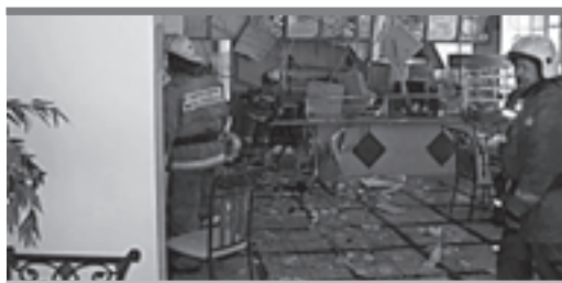
На месте взрыва.

Отметим, что осенью 2010 года Государственная инспекция труда в Пермском крае опубликовала на своем сайте информацию, что взрыв произошел из-за избыточного давления в баллоне.