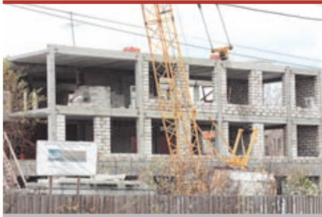
Уже второй подрядчик не справляется. Может, в заказе дело?..

Мэрия планирует расторгнуть договор с подрядной организацией и «законсер-