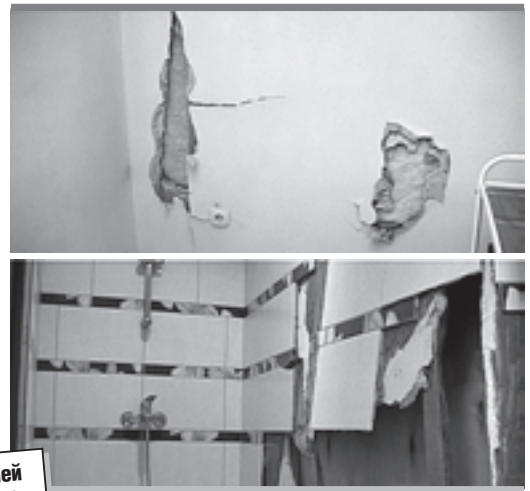
Поврежденные стены медцентра

В 2004 году медакадемией с ООО «Строительно-монтажный трест № 17» заключен договор долевого строительства пристройки к стоматологической клинике по ул. Луначарского, 74. Департаментом планирования и развития территории города Перми выдано разрешение № 294/2004 на ввод данного объекта в эксплуатацию. По свидетельству о государственной регистрации, выданному в октябре 2005 года, подтверждается, что первый этаж пристройки общей площадью 177,9 кв. м принадлежит медакадемии. Как раз через первый этаж и осу-