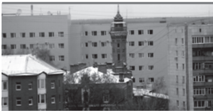
Из окон администрации каланчу хорошо видят, но не замечают

Казалось бы — острая проблема, над решением которой должны биться городские, краевые и федеральные структуры. Но в министерстве общественной безопасности (МОБ) края корреспондента «ПО» сначала послали в городскую администрацию, но узнав, что общежитие ведомственное, направ-