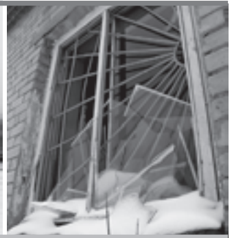
Еще недавно здесь кипела студенческая жизнь

ный шантаж. Людям в ультимативной форме предлагают подписать договор, а в случае неподписания угрожают выселением. Более того, перестают выставлять счета на оплату квартир. А по закону, если человек в течение 6 месяцев не произвел оплату, то его можно выселить. То есть не мытьем, так катаньем пытаются заставить людей освободить жилые помещения.