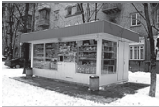
Теперь в ларек — только за шоколадками