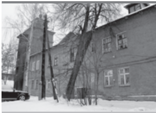
Да и зачем людям кухня? Без нее жить можно!

Проверка показала, что здание не может быть признано непригодным для жилья и расселено, так как не является жилым. Суд признал такое заключение незаконным и обязал создать новую комиссию.