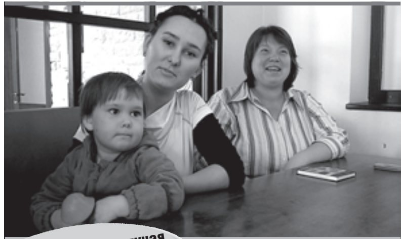
Мечты многодетных отложены до весны

На региональном уровне после долгих мучений появился Закон Пермского края от 01.12.2011 № 871-ПК «О бесплатном предоставлении земельных участков многодетным семьям» (вступил в силу 16.12.2011).