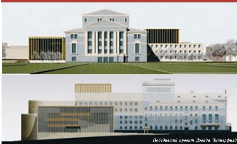
Победивший проект Дэвида Чипперфилда

Проект Дэвида Чипперфилда по реконструкции театра был признан победителем международного конкурса в марте 2010 года. По проекту комплекс театральных зданий будет включать в себя реконструированное существующее здание театра с залом ориентировочно на 900 мест, а также новую сцену на 1100 мест. При этом «благоуст-