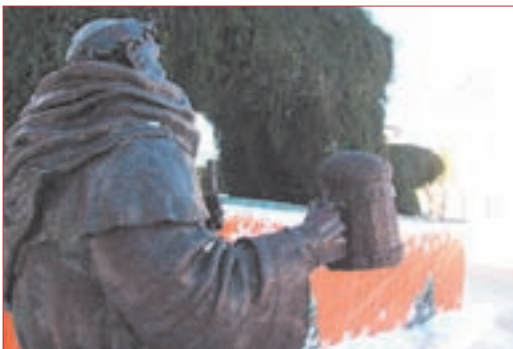
Культура иллюстрирует досуг молодежи