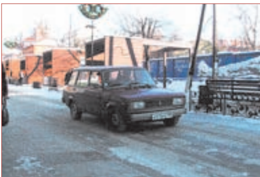
На пешеходной улице прекрасно себя чувствуют автомобили