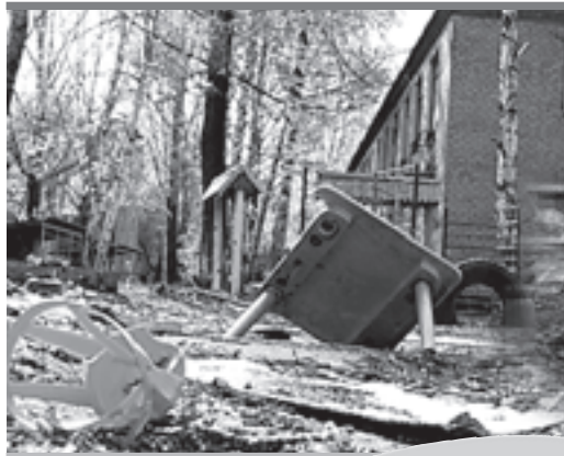
Закрытый детсад №255

Но всех детей по группам не растолкаешь, а очередь по плану должна снижаться. Несмотря на то, что по закону получение пособия по «Маминому выбору» не является основанием для исключения ребенка из регистра, многие территории, опасаясь нагоняя сверху, отличились. Например, в Юсьвинском р-не специалисты отдела образования администрации ставили родителей перед выбором: или получать пособие, но выбывать из очереди, или оставаться в ней, но без выплаты денег. А если учесть, что уровень доходов в Коми округе значительно ниже, чем в среднем по краю, то мамы долго не думали.