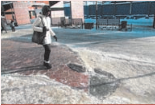
Все удобства сведены к покрытым льдом пандусам

«Пермский Арбат» еще даже не начинал свое существование.