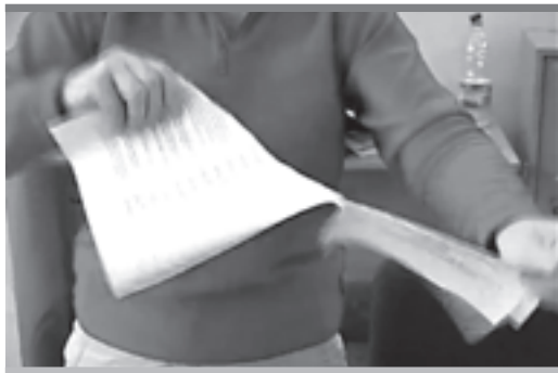
Кадр из сюжета «НеСекретно» про нарушения в УИК № 2943 Индустриального района Перми (председатель УИК рвет уже подписанный протокол)

Владимир Маркин скрыл от прессы, какие конкретно роли-