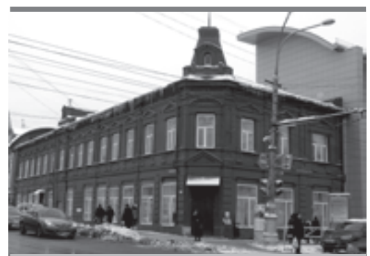
Управление Федеральной службы государственной регистрации, кадастра и картографии по Пермскому краю (Росреестр, ул. Петропавловская, 51)

Несогласие землепользователей могут вызвать и использованные факторы стоимости земель