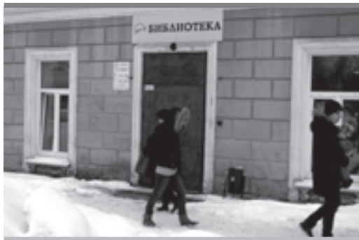
Пермским библиотекарям наконец повысят зарплату

С воспитателями все вышло сложнее. Надежда Кочурова сообщила, что для одновременного повышения зарплаты работников дошкольных образовательных учреждений — воспитателям детсадов — с 1 апреля в бюджете