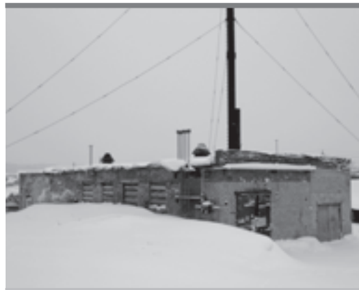
Та самая недоремонтированная котельная (с. Фоки)

Прекращено дело в отношении заместителя министра куль-