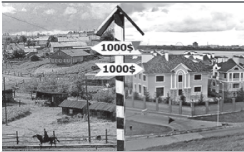
Рыночная стоимость может оказаться одинаковой для участка без света и газа и для участка в элитном микрорайоне

Пока, до вступления в силу постановления краевого правительства № 727-п, кадастровая сто-