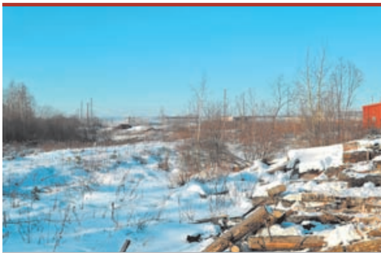
Крайние чиновники не знают, как рачительно использовать лесное богатство.

И здесь позволяйте сделать небольшое отступление и цитировать из правительственного постановления напомнить суть приоритетных инвестиционных проектов в области освоения лесов: «К инвестиционным проектам относятся инвестиционные проекты по созданию и(или) модернизации объектов лесной инфраструктуры (лесных дорог, лесных складов и др.) и(или) лесоперерабатывающей инфраструктуры (объектов переработки заготовленной древесины и иных лесных ресурсов, биоэнергетических объектов и др.), суммарный объем капитальных вложений в