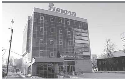
2 млн рублей не получил город за этот участок

Но даже в 2008 году, после извещения о смене землепользователя, в администрации Перми не