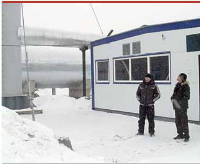
Частная котельная исправно работает, но денег за работу не получает