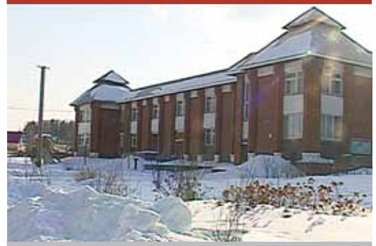
Дети сельского главы на его дискотеки не ходят, в Германии живут