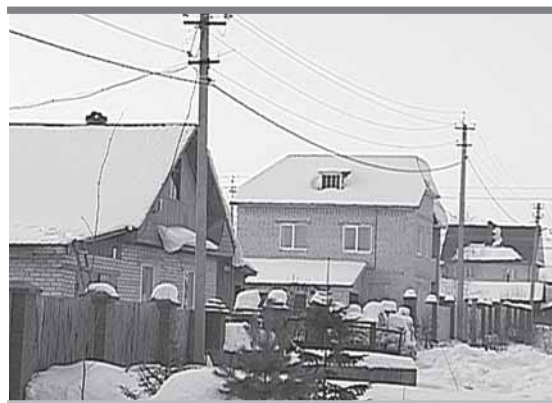
Жители Новобродовского хотят, наконец, жить спокойно