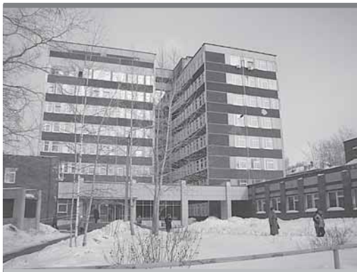
Очереди из желающих кормить пациентов больниц — нет!

Чуть больше 2 руб. — надбавка к тарифу, видимо, рассчитанная и на аренду, и на оплату