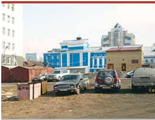
Гости города рискуют подхватить «эстетическое бешенство»