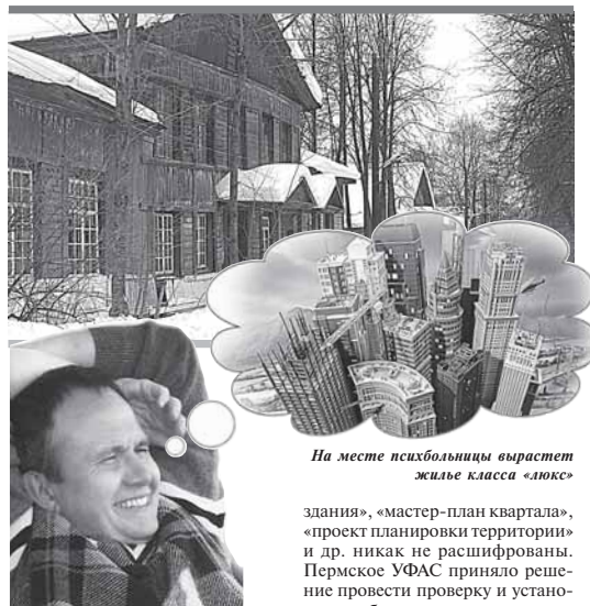
На месте психбольницы вырастет жилье класса «люкс»

Первым было продано право на развитие территории в районе ДКЖ – кв. № 745 и 746. Расселением ветхих домов (начатым городскими властями) и застройкой займется «ПАИЖК» (100% акций в собственности краевых властей).