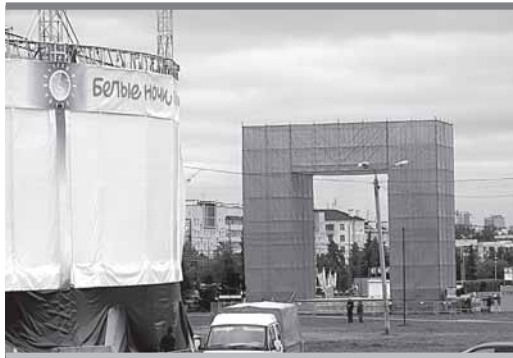
Нынче красная П станет белой, а из городской казны уйдут на 6 млн больше (136 млн руб.)