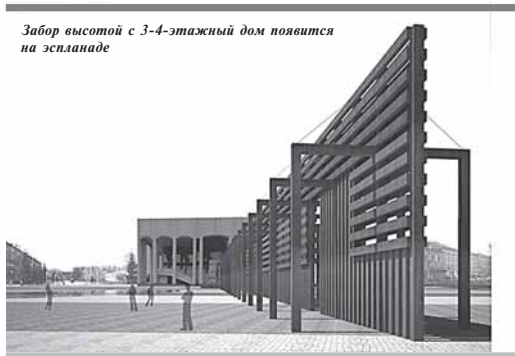
Забор высотой с 3-4-этажный дом появится на эспланаде

Предшлющие годы их только сокращали, а теперь (видимо, из-