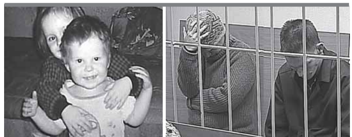
Садисты-родители наказаны. А должностные лица?

Даже после этого чудовищного убийства в отношении аутсорсинга не были сделаны никакие выводы.