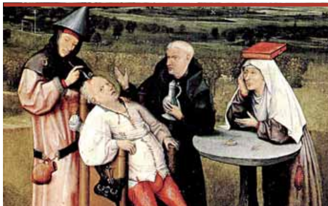
Иероним Босх. Извлечение камня глупости

Только по муниципальным контрактам (на 2011 год) направлено в СМИ более 118 млн руб. И это не все, большой объем платежей приходится на автономные учреждения. К слову, 118 млн руб., потраченных на пиар пермской власти в прошлом году, — это больше, чем власть тратит на различ-