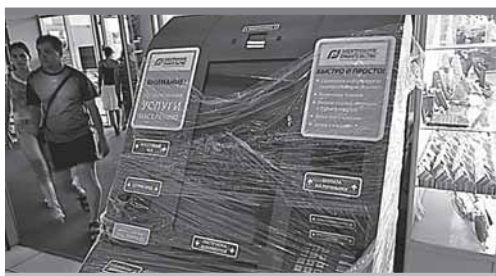
Терминал для оказания госуслуг населению в одном из торговых центров Татарстана