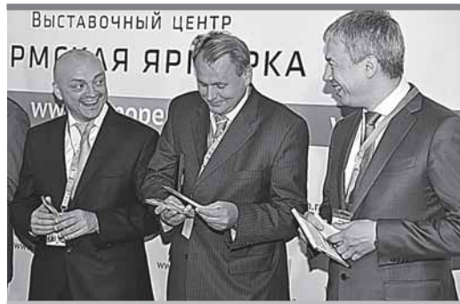
Какой смешной пермский бизнес!

Впрочем, эксперты полагают, что стартапам вообще вредны ин-