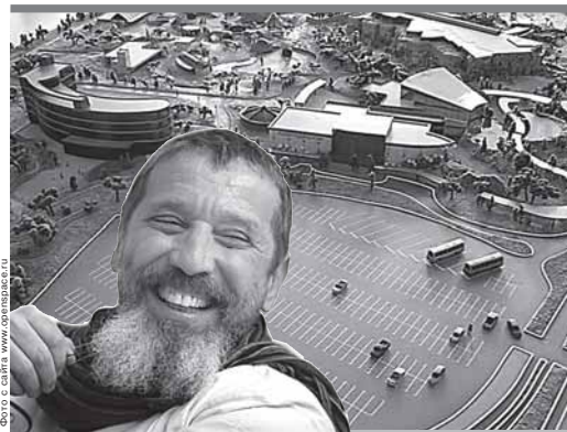
Шантаж Мильграму удался

В настоящее время подготовлены три варианта технического задания на разработку бизнес-