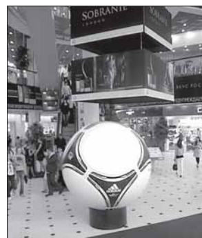
Пермь встречает ЕВРО-2012

Три сборные носили звание чемпиона Европы и чемпиона мира (ФРГ, Франции и сейчас Испании). ФРГ и