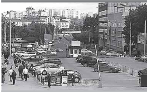
Владельцы парковки не хотят оставлять теплое место

Автостоянка на Перми II работает незаконно.