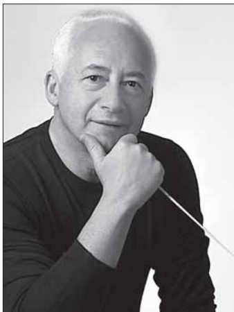
лармонического оркестра под управлением Шарля МЮНША».

На вопрос, кто его любимый композитор, маэстро отвечает, что у него нет конкретно одного. «Нельзя выходить на сцену и не любить то, что ты исполняешь. Это нечестно, да и зритель сразу почувствует фальшь. А если говорить проще, то в детстве меня потряс Бах, он нашел тот код, который открывает дверь в гармонию души. И потом, все зависит не от конкретного композитора или дирижера, а от того, «как, когда и кто». Например, меня потряс Гимн СССР в исполнении Бостонского фи-