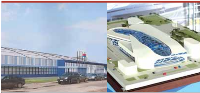
Городу нужен стадион, а не очередной «проект»