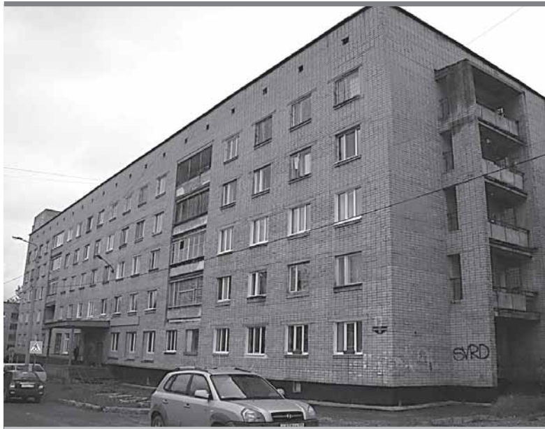
Если вопрос не решится в ближайшее время, преподаватели навсегда останутся гостями в собственном доме