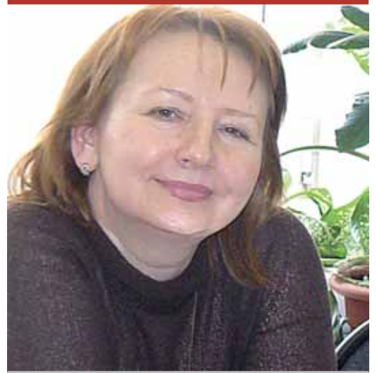
Хранить прошлое и открывать новое — предназначение истинных профессионалов