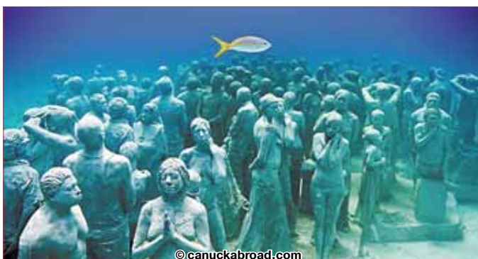
Музей подводных скульптур в Канкуне