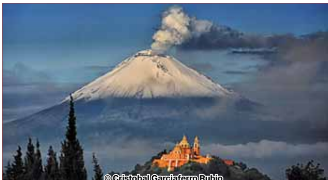
Вулкан Попокатепетль

Мексику нужно увидеть, попробовать и прочувствовать на себе эту пеструю смесь испанской, индейской и карибской культур. Пожалуй, единственный недостаток путешествий в Мексику – это длительный перелет.