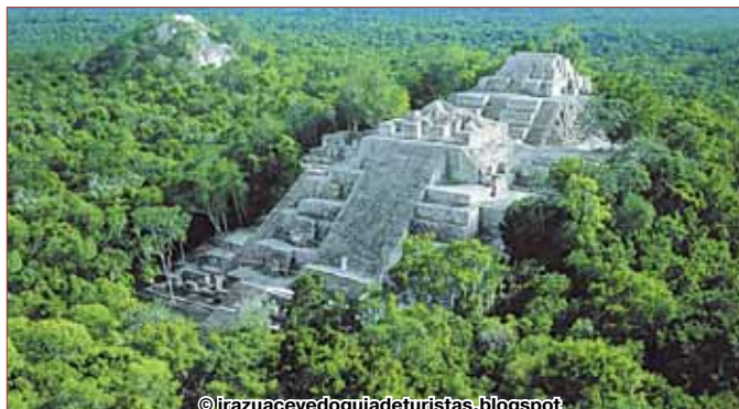
В прошлом могущественный город майя Калакмуль