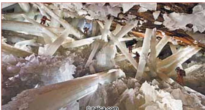
Пещера гигантских кристаллов Найка