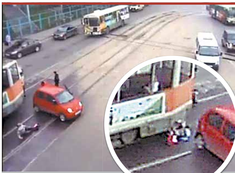
Сорокалетнего мужчину госпитализировали с переломом костей таза...

деня, напротив дома № 115 не перевела стрелки трамвайных путей и допустила столкновение с трамваем 71-605, под управлением мужчины 1984 года рождения. Оба трамвая двигались по 7-му маршруту.