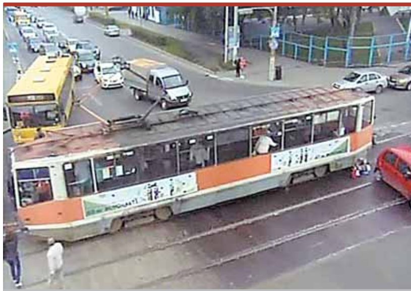
Вагоновожатая сначала «догнала» автобус №74, который выехал на трамвайные пути, а потом сдала назад...

На минувшей неделе в Перми произошло два ДТП с участием трех трамваев. Пострадали четыре человека.