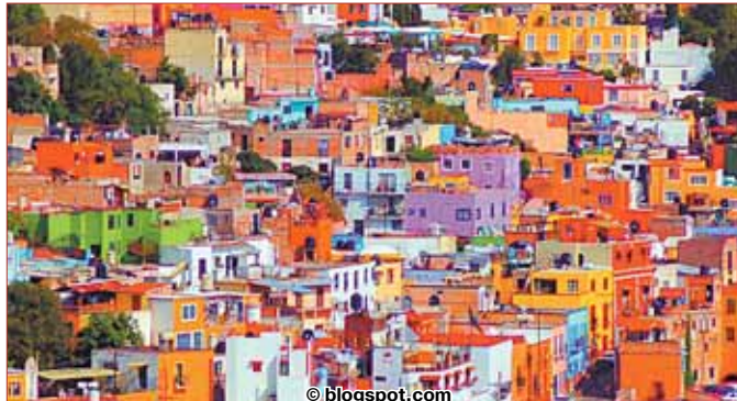
Цветные дома города Гуанахуато

Ежедневная газета «Пермский обозреватель». Выходит 5 раз в неделю. РАСПРОСТРАНЯЕТСЯ БЕСПЛАТНО