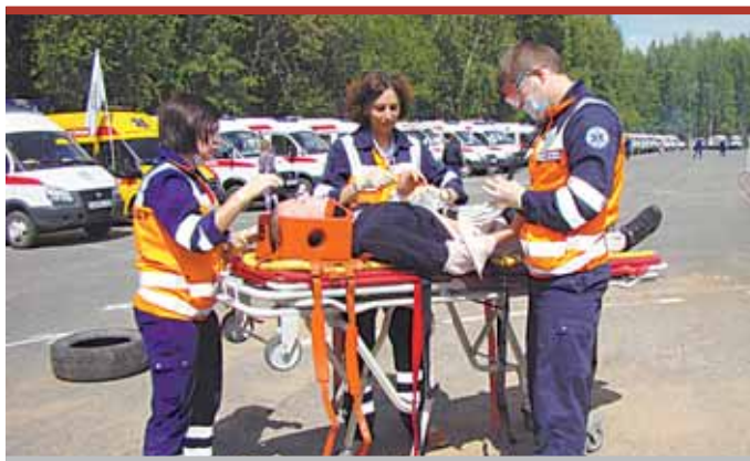
Организаторы вместо резиновых кукол, на которых врачи соревновались раньше, предложили настоящих людей

— Когда на месте ДТП появляется четверо пострадавших, возникает вопрос