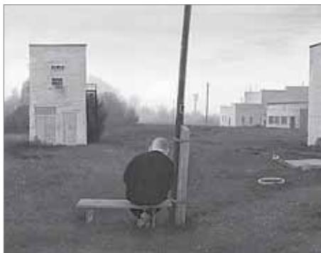
В ожидании восхода солнца