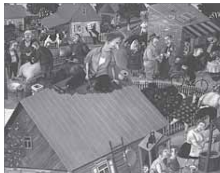
Явные преимущества точки кругового обзора