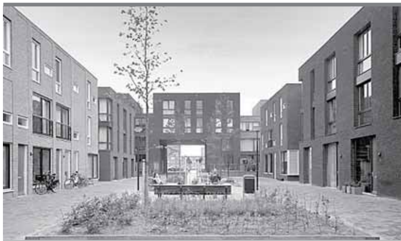
В Интернете есть сайт о прекрасном будущем 179 квартала — http://block179.ru . Интересно, как будет отличаться реальность от картинок?

Застраивать квартал № 179 в Перми будет компания «Кортрос».