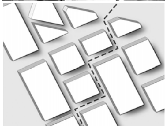
Улицы квартала спроектированы так, что нет никаких тупиков и закоулков

ной платы в год – 145,8 млн руб. За 6 лет сумма арендной платы составит 874,8 млн руб.