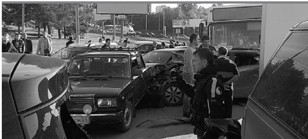
Перед пострадавшими 4 августа в автобусе маршрута № 36 никто даже не извинился!

В результате инцидента 8 чел. получили ожоги. Как пояснили в управлении здравоохранения администрации Перми, два пассажира отказались от госпитализации, еще двое с ожогами менее 10% кожи были направлены в травмпункт. Четверо госпитализированы в специализированное