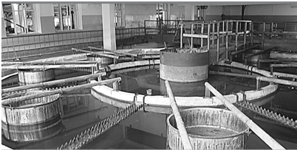
Очистные сооружения ООО «Новогор-Прикамье» выдержали проверку

Мы рассматриваем внесенную в муниципалитет схему водоснабжения и водоотведения Перми, и нам важно знать, в какие сроки, в каком объеме будут проведены работы по реконструкции сетей. И, конечно, нас