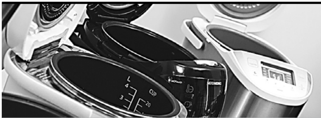
Качество антипригарного покрытия имеет огромное значение

явили себя по-разному, но у каждого был какой-то заметный недостаток, который не позволил занять высокую позицию в рейтинге.