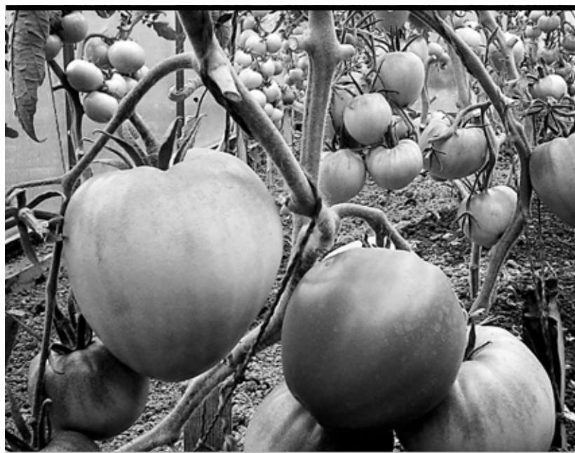
В крае необходимо актуализировать перечень инвестпроектов на 2015 и последующие годы в части развития растениеводства

сти. Сегодня необходимо актуализировать перечень инвестпроектов на 2015 и последующие годы в части развития растениеводства, животноводства. Мы совсем недавно обсуждали с Росимуществом возможность увеличения посевных площадей за счет передачи неиспользуемых федеральных земель в краевую собственность. И Росимущество наши предложения поддержало.