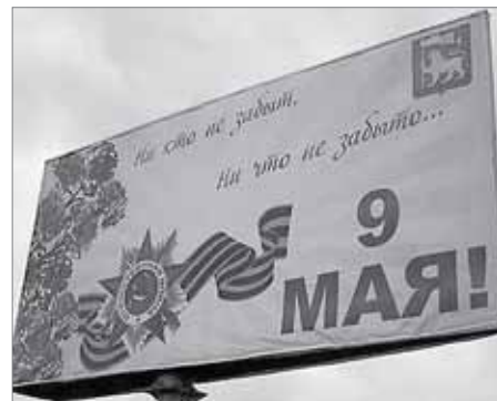
«Ни что», кроме орфографии