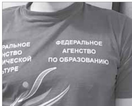
...в котором работают АГЕНЫ