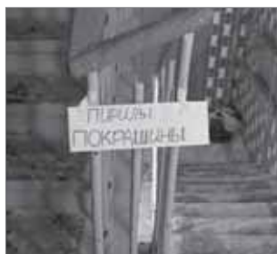
Ну, хоть предупредили...