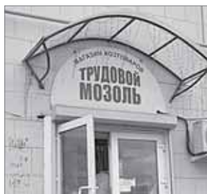
Нужно больше отдыхать, чтоб не натереть трудовой мозоль