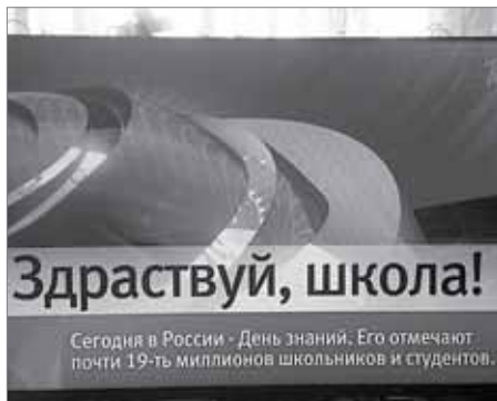
Отметили День знаний «как надо»

Ошибки встречаются и в роликах на центральных телеканалах, и в уличных постерах, и на ценниках, объявлениях, вывесках... Радует только, что от ошибок рекламистов не зависят ничьи жизни, поэтому иногда над ними можно просто посмеяться. AdMe.ru собрал образцы всевозможных «ашыбок» и «очепятков». Диву даешься!