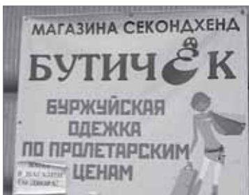
Магазина Бутичск. Привет пролетариям от буржуев!