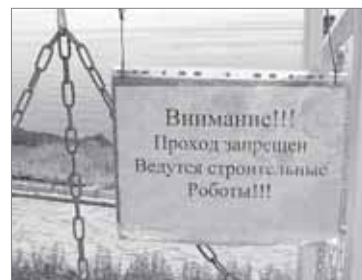
Берегись строительных роботов!

Ежедневная газета «Пермский обозреватель». Выходит 5 раз в неделю. РАСПРОСТРАНЯЕТСЯ БЕСПЛАТНО