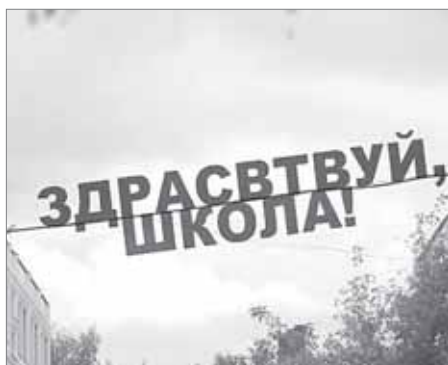
И опять не получилось!