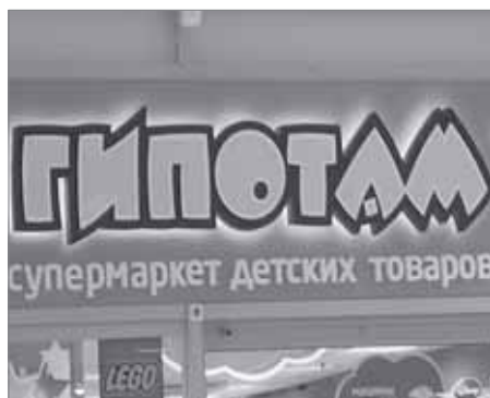
В поисках потерянного По