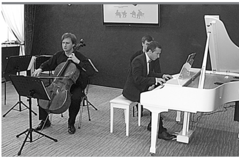
После подписания соглашения солисты оркестра MusicAeterna дали концерт для студентов, педагогов и гостей «Вышки»

пытаясь выяснить: кто же такой зритель театра, люди какой категории ходят в театр, зачем, как отзываются о спектаклях. Итоги мы передали в театр.