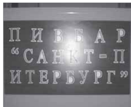
Вот такой вот Итербург