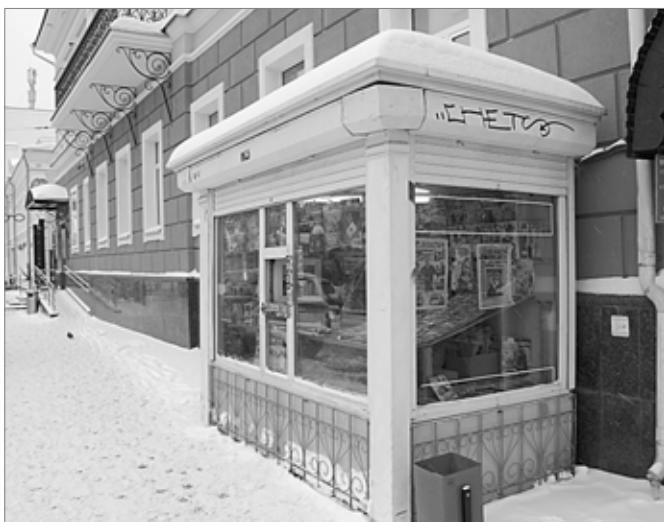
Плата за размещение НТО в Перми — одна из самых низких по сравнению с аналогичными городами

Предложение об увеличении платы за размещение торговых объектов поддержано профильным комитетом гордумы.