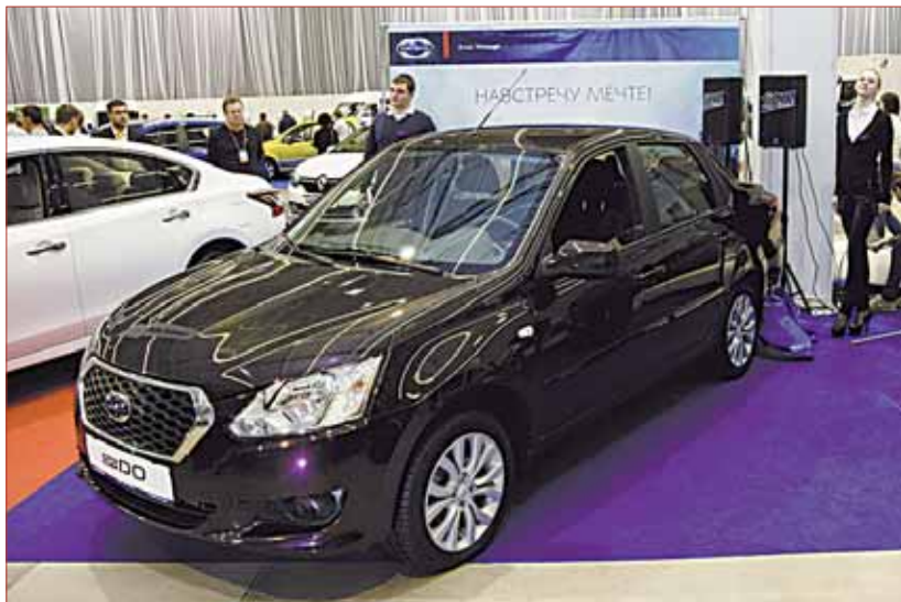
Datsun выглядит, как средний вариант Logan и Granta

Автомобилизация в Пермском крае составляет 224 автомобиля на тысячу населения, что немного ниже, чем общероссийский уровень. Толчком для развития может стать выбытие старых автомобилей, у нас он 3%, в развитых странах – 5% в год.