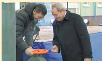
«Благословить» начало проекта стоимостью 2 млрд руб. приехали топ-менеджеры КЭС и федеральные чиновники