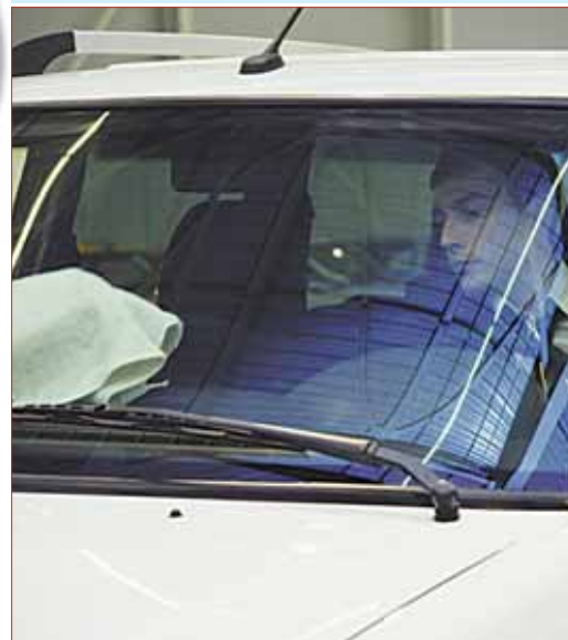
Авотрейдеры намывают машины, придавая продажный лоск

Известно, что модели премиум-класса любят российские чиновники: часто дорогие автомобили фигурируют в госзакупках. Казалось бы, вышел закон, который запрещает госструктурам покупать автомобили, произведенные не в России. Крупноузловая сборка на заводах в России позволяет чиновникам остаться в любимых креслах дорогих авто.