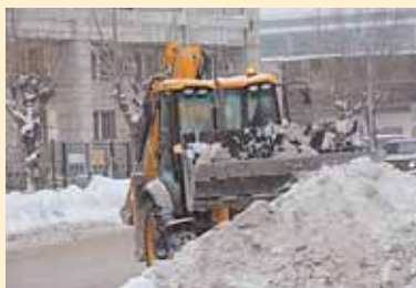
В снегуборочную ночь