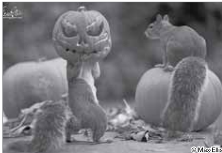
К празднику готов!

Бывает, одна фотография может рассказать целую историю или вызвать бурю эмоций. Иногда это просто удачный ракурс или нужный момент. Иногда красивейший пейзаж или уникальное явление. Но чаще всего это просто хроника нашей удивительной повседневной жизни. На этих снимках — часть того, что поразило в октябре.