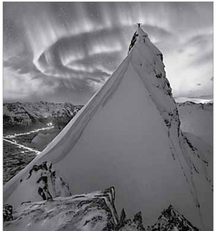
Тем временем в Норвегии...

Ежедневная газета «Пермский обозреватель». Выходит 5 раз в неделю. РАСПРОСТРАНЯЕТСЯ БЕСПЛАТНО