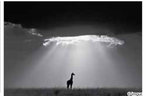
Одинокий жираф в кенийском заповеднике