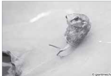
Не гони! Я говорю, не гони!