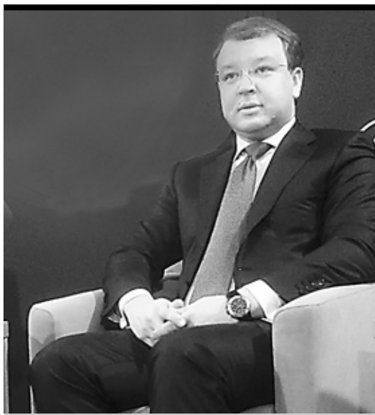
«Целью налоговой политики является сохранение стабильности бюджетной системы региона»

В этот период введены льготы в Пермском крае. И это единственный в округе регион, который предоставляет именно такие условия для получения льгот. Многие регионы стали предоставлять дополнительное льготирование уже после 2008 года: