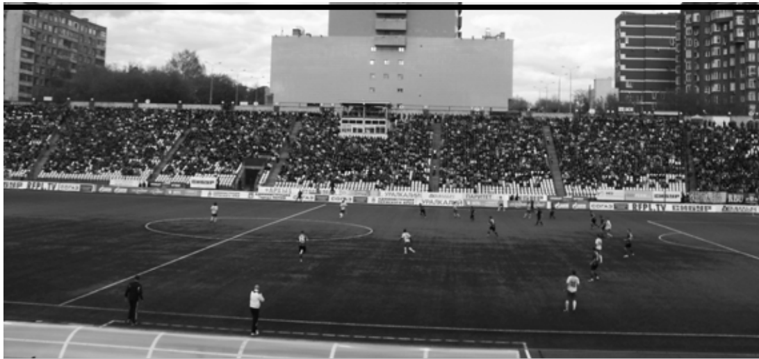
Президенту московского «Локомотива» не нравится... а гендиректору «Амкара» нравится...

Самое интересное, что «Звезда-2005» буквально за два дня до этого «реверанса», 13 ноября, провела здесь матч Кубка Лиги чемпионов, и состояние стадиона не вызвало нареканий ни со стороны футболисток-соперниц из Швеции, ни со стороны членов комиссии УЕФА.