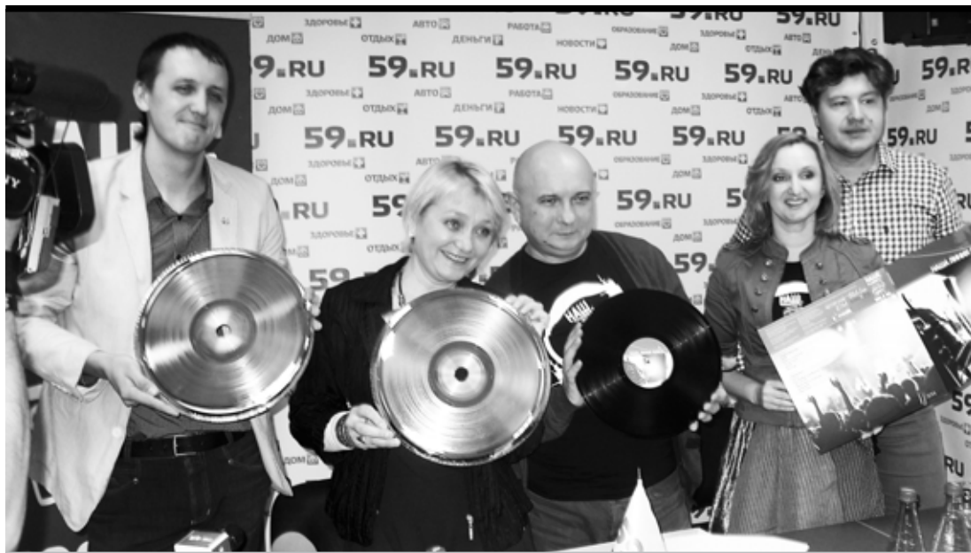
Диск «Наша линия взлета» ознаменовал 13-летие вещания радиостанции «Наше радио» в Перми