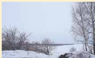
Проблемы берегов обсудили в рамках акции «Дни воды»