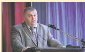
Состоялся саммит микрорайонов города