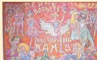
В новой «Галерее» открылось «непокоренное» искусство