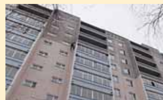
Вернуться домой (ул. Ст. Разина, 36)