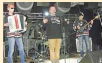
Поэтический фестиваль «Компрос» отправил крылья под «гу» уральских поэтов