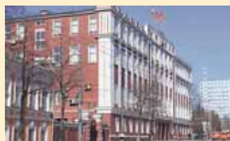
Жить надо по средствам (о бюджете Перми)