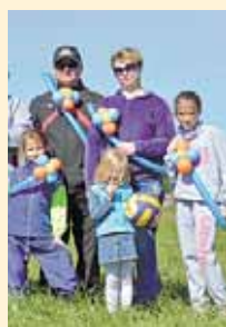
Семь разные нужны, семь разные важны