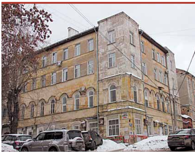
Разрушения представляют опасность для жизни и здоровья жителей

«ПО» не раз писал о сложной ситуации в доме № 7 по ул. Куйбышева. Скорее всего, в дело уже может вмешаться прокуратура – отсудить у администрации города капитальный ремонт здания.