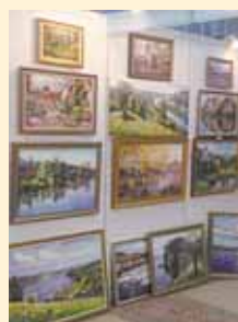
На «Арт-Перми» можно увидеть работы Дали, Матисса, Пикассо и Шагала