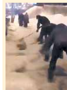
«Толщина снега — 25-28 см!» Четверо пермяков сами почистили тротуар