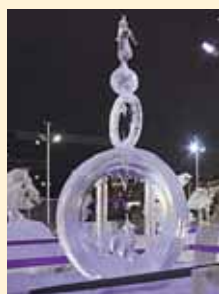
Пермь имеет шансы на дальнейшее развитие конкурса снежной и ледовой скульптуры