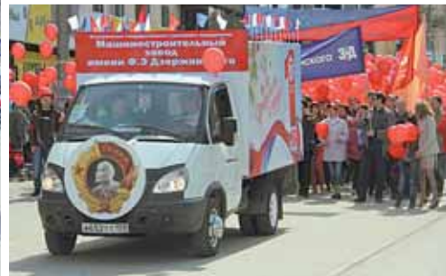
Промышленные предприятия с многолетней историей и молодые компании объединил Первомай