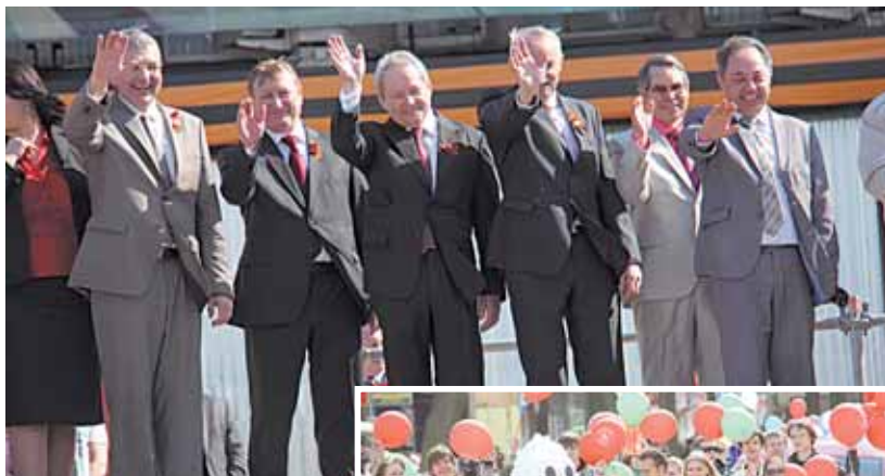
Руководство города и края приветствует трудящихся