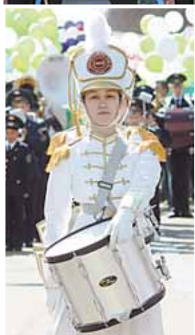
Под флаги весны и труда встали практически все вузы города