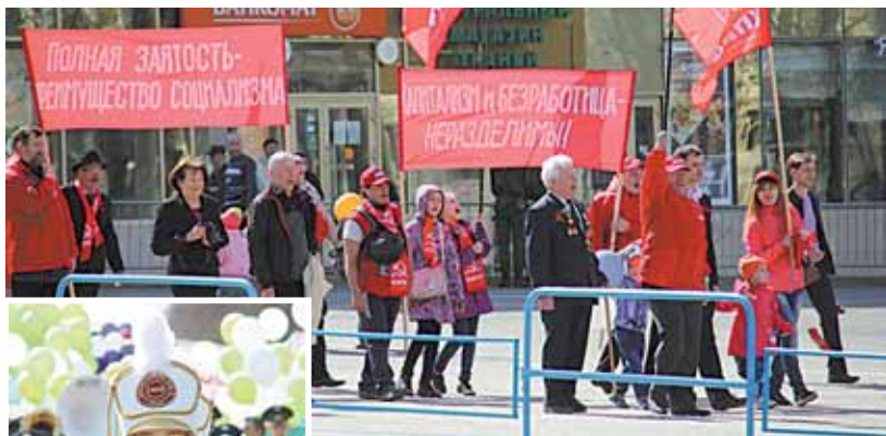
Политические силы Перми и края также были представлены на демонстрации