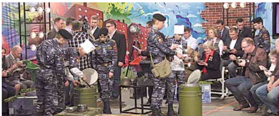
Шесть серий «Понюхать порошу» будут показаны на «Российском информационном канале»

Такого на отечественном телевидении еще не было... Пермь давно уже ассоциируется с сериалом «Реальные пацаны». И вот пермские мужики создали действительно качественный телепродукт.