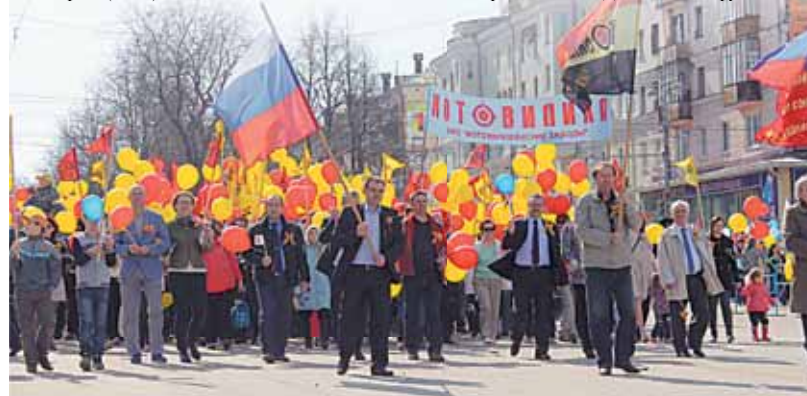
Колонна «Мотовилихинских заводов»